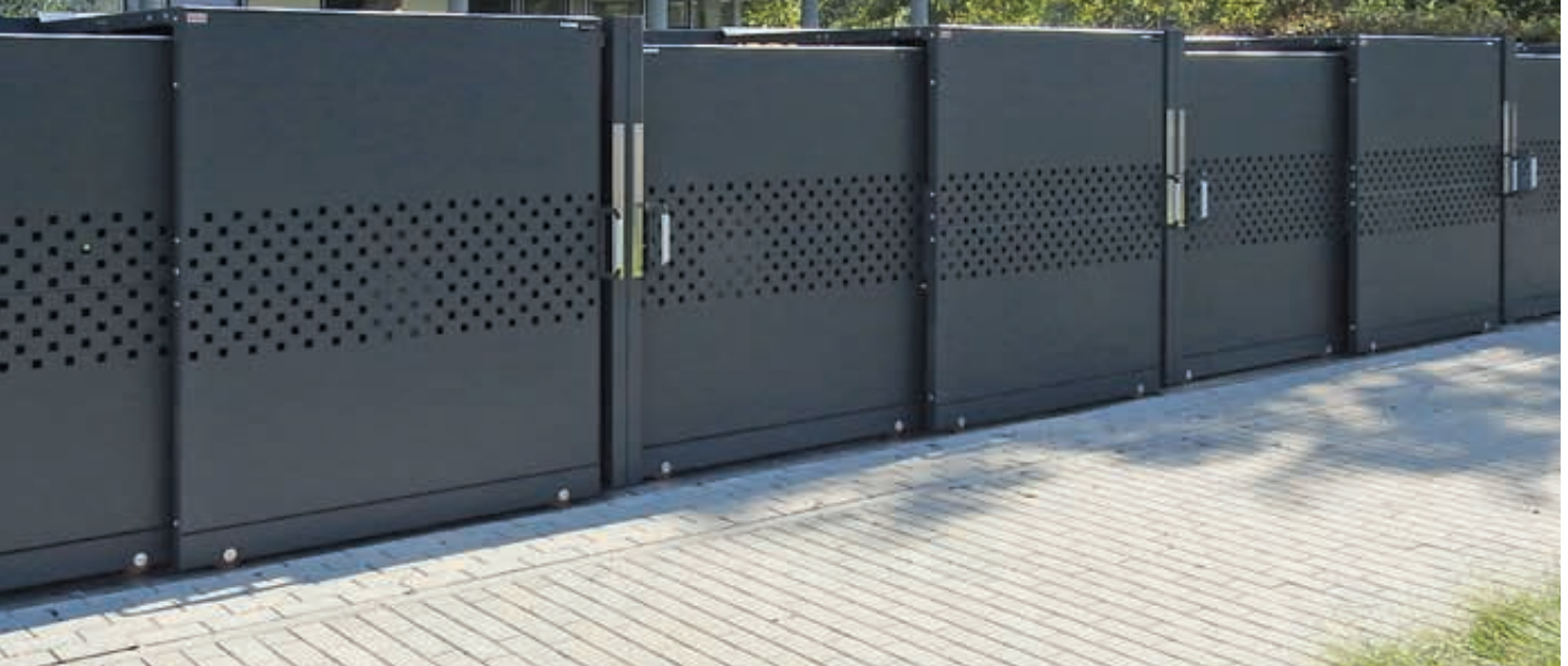
Müllbehälter-Doppelschrank STYLEOUT® QUBIS 1100 für 4-Rad-Abfallgroßbehälter, Schiebetüren mit Quadratlochung, Aluminiumkonstruktion in RAL 7016 anthrazitgrau