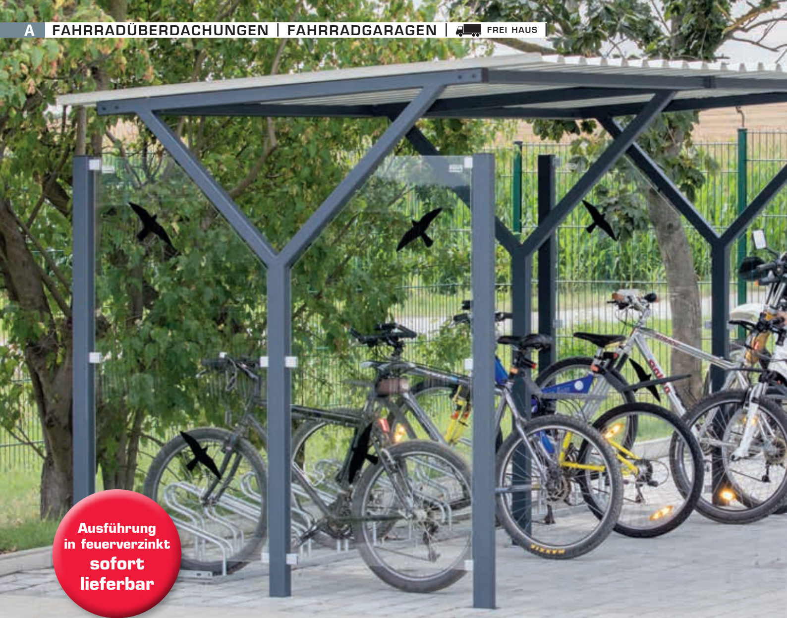
Fahrradüberdachung Z08, Dachbreite x Dachtiefe 4800 mm x 2400 mm, inkl. Seitenwände ESG Klarglas mit Raubvogelaufkleber sowie Fahrradständer UNIVERSAL, Stahlkonstruktion in RAL 7016 anthrazitgrau