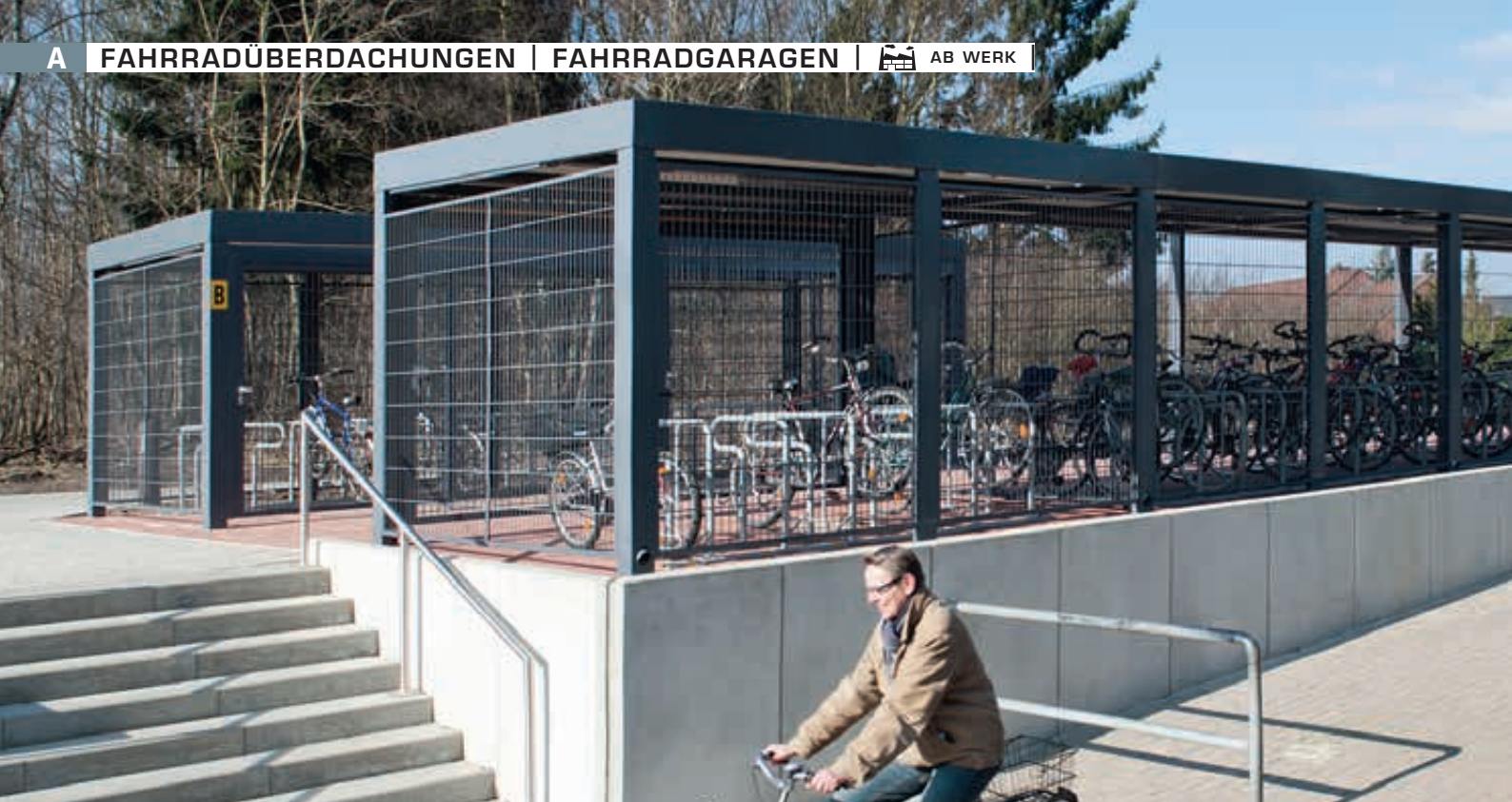
MULTIPOINT® Rad Dachbreite x Dachtiefe je Anlage 16000 mm x 8000 mm, Seiten- und Rückwände mit Doppelstabgittermatten, mit Fahrradparker HEDLAND, Stahlkonstruktion in RAL 7015 schiefergrau