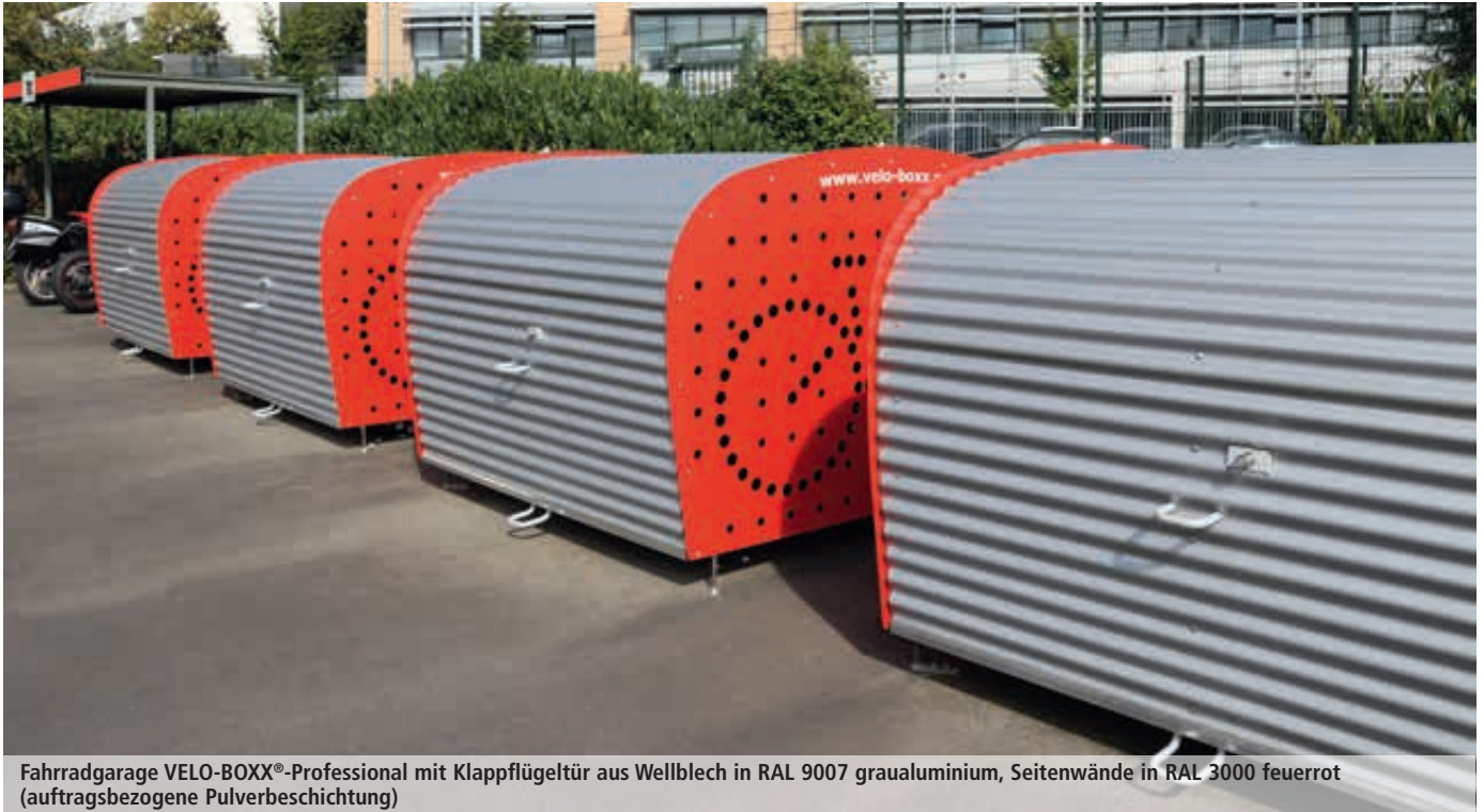
Fahrradgarage VELO-BOXX®-Professional mit Klappflügeltür aus Wellblech in RAL 9007 grau aluminium, Seitenwände in RAL 3000 feuerrot (auftragsbezogene Pulverbeschichtung)

Weitere Bilder, Informationen und Ausschreibungstexte: www.ziegler-metall.de