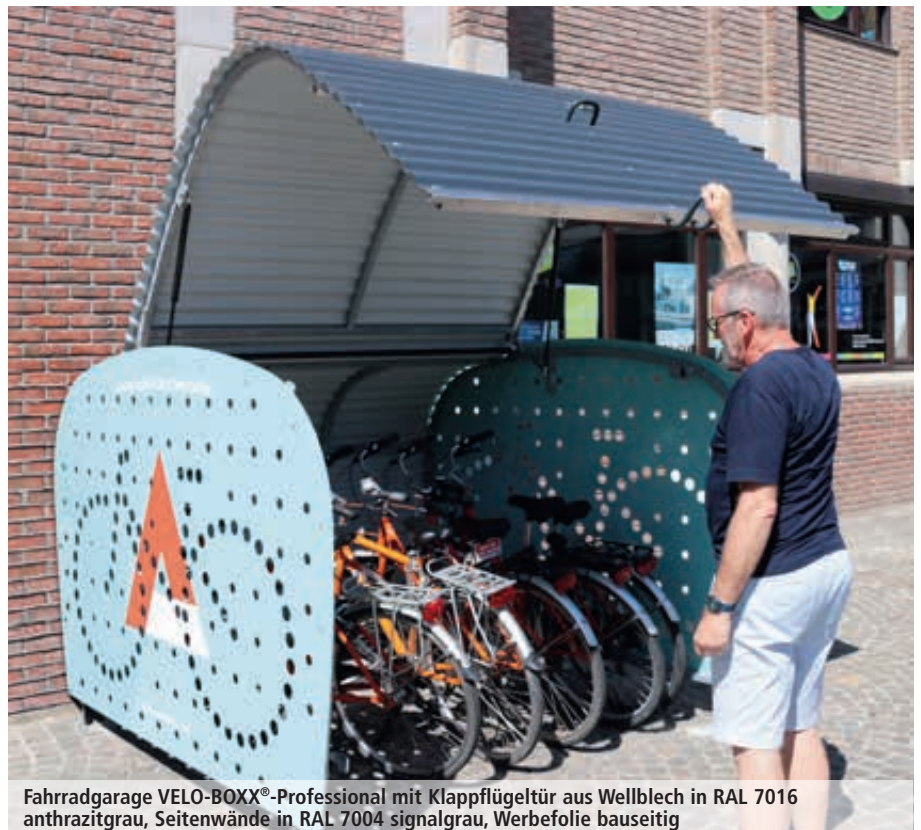
Fahrradgarage VELO-BOXX®-Professional mit Klappflügeltür aus Wellblech in RAL 7016 anthrazitgrau, Seitenwände in RAL 7004 signalgrau, Werbefolie bauseitig