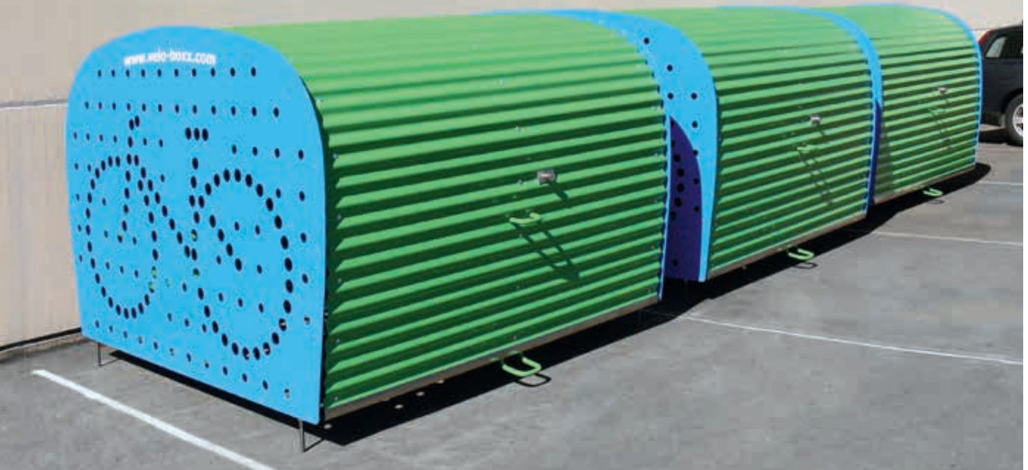
Fahrradgarage VELO-BOXX®-Professional mit Klappflügeltür aus Wellblech in RAL 6018 gelbgrün, Seitenwände in RAL 5012 lichtblau (auftragsbezogene Pulverbeschichtung)