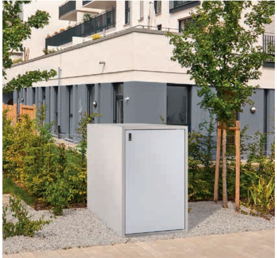
Fahrradgarage ARLINGTON, Korpus Sichtbeton glatt, basisgrau, Türblatt RAL 7035 lichtgrau

Weitere Bilder, Informationen und Ausschreibungstexte: www.ziegler-metall.de