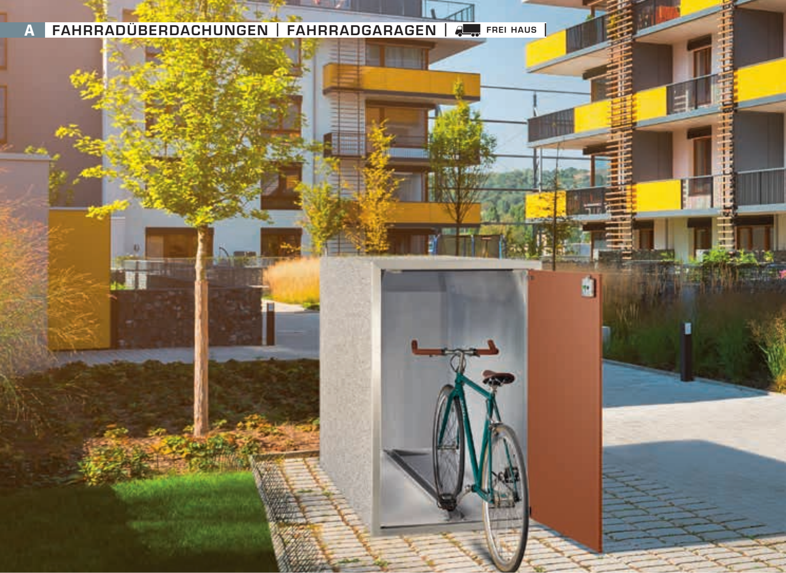
Fahrradgarage ARLINGTON, Korpus Sichtbeton gewaschen, perlgrau, Türblatt RAL 8002 signalbraun, Führungsschiene, Kastenschloss mit Notentriegelung von innen