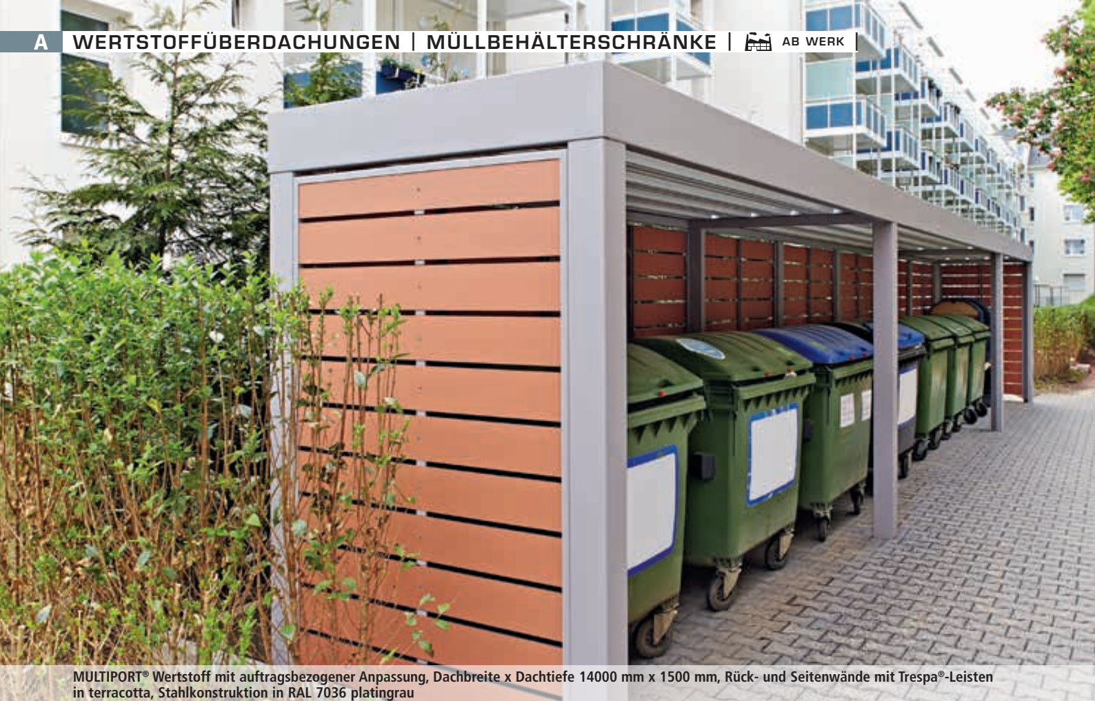
MULTIPOINT® Wertstoff mit auftragsbezogener Anpassung, Dachbreite x Dachtiefe 14000 mm x 1500 mm, Rück- und Seitenwände mit Trespa®-Leisten in terracotta, Stahlkonstruktion in RAL 7036 platingrau