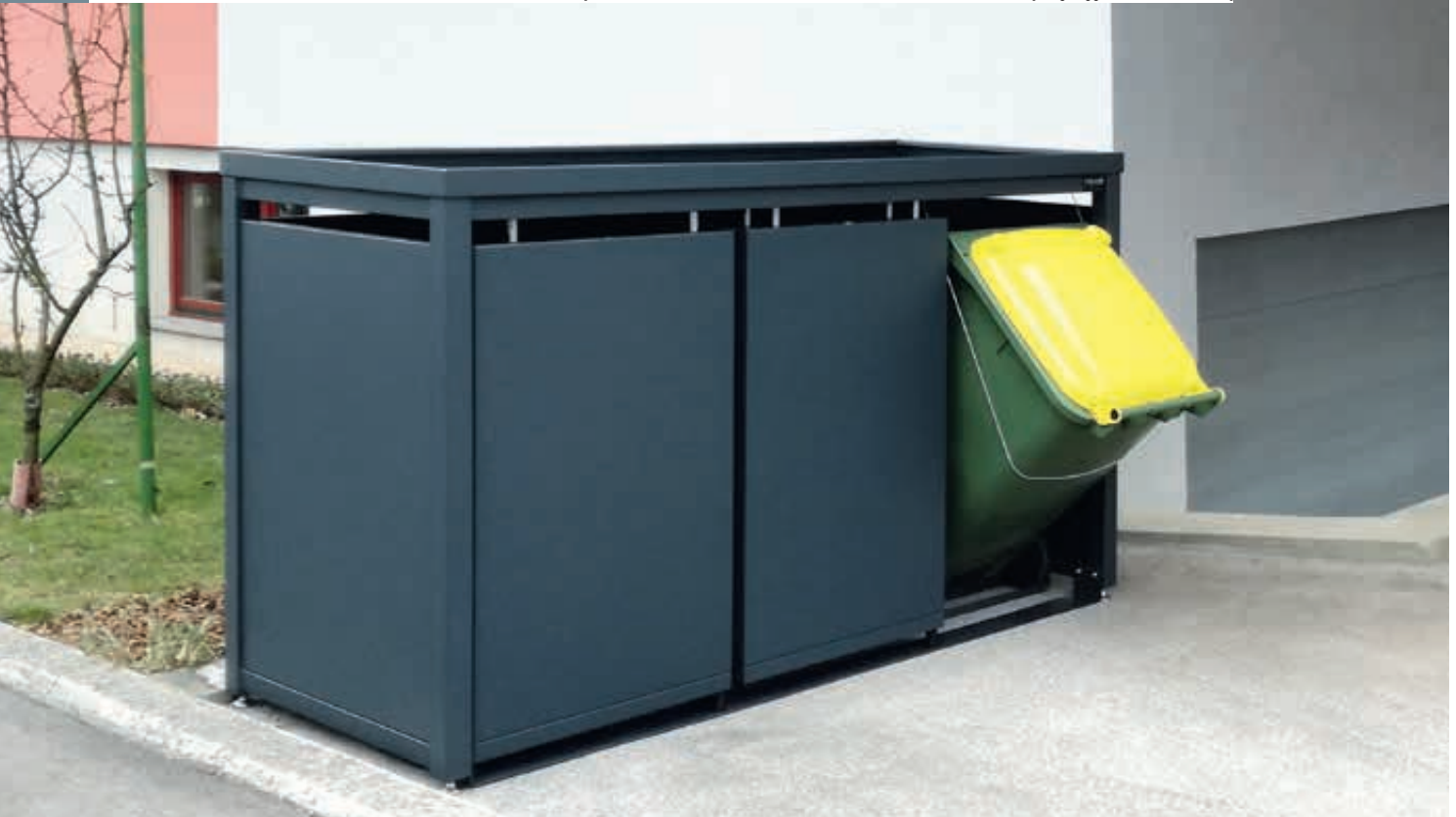
Müllbehälterschrank STYLEOUT® BLANK mit Pflanzdach, Dreifachschränk, Stahlkonstruktion, Dach, Schiebetüren, Rück- und Seitenwände in RAL 7016 anthrazitgrau