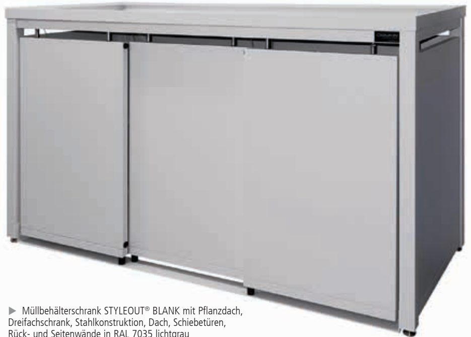
► Müllbehälterschrank STYLEOUT® BLANK mit Pflanzdach, Dreifachschrank, Stahlkonstruktion, Dach, Schiebetüren, Rück- und Seitenwände in RAL 7035 lichtgrau