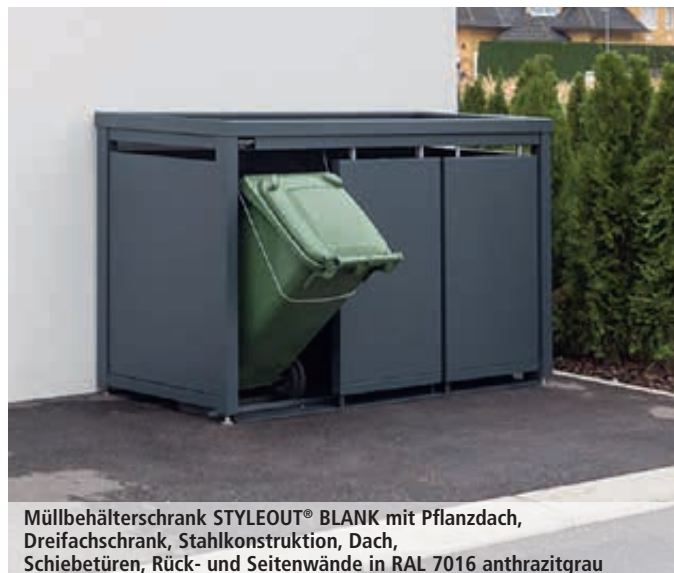
Müllbehälterschrank STYLEOUT® BLANK mit Pflanzdach, Dreifachschränk, Stahlkonstruktion, Dach, Schiebetüren, Rück- und Seitenwände in RAL 7016 anthrazitgrau

Oberfläche / Farbe: Alle Stahlteile haben eine KTL-Beschichtung (kathodische Tauchlackierung) und sind pulverbeschichtet in DUKIN-Standardfarben. Alle Aluminiumteile sind pulverbeschichtet in DUKIN-Standardfarben.