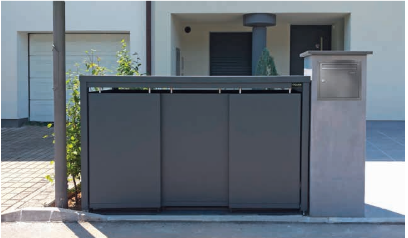
Müllbehälterschrank STYLEOUT® BLANK mit Pflanzdach, Dreifachschrank, Stahlkonstruktion, Dach, Schiebetüren, Rück- und Seitenwände in RAL 7016 anthrazitgrau

Weitere Bilder, Informationen und Ausschreibungstexte: www.ziegler-metall.de