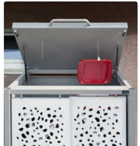
▲ Detail: Klappdach