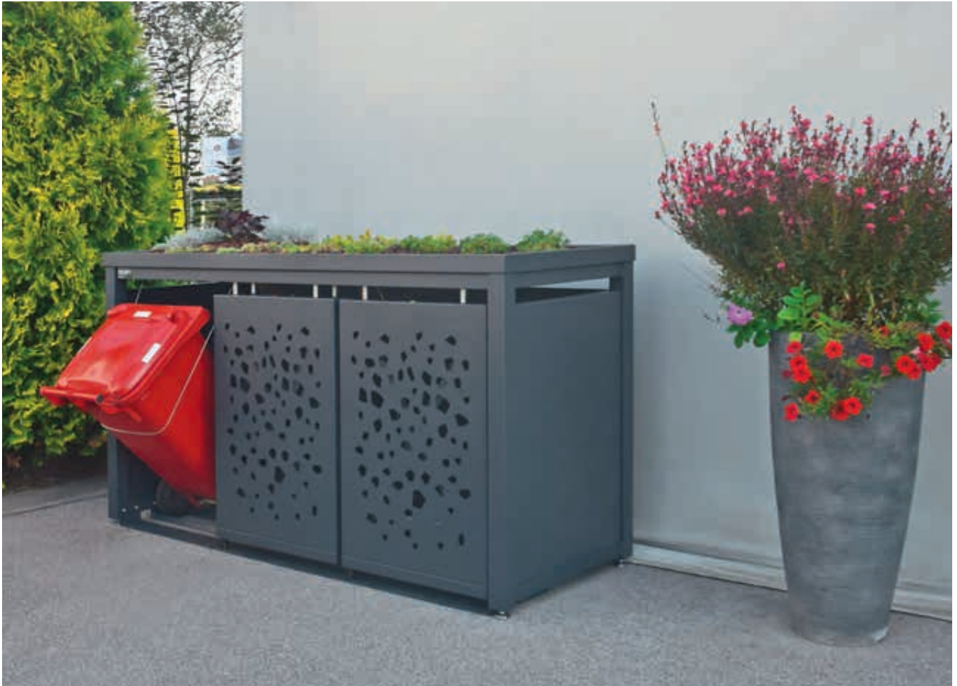
Müllbehälterschrank STYLEOUT® TOMO mit Pflanzdach, Dreifachschrank, Dachbegrünung (bauseits), Stahlkonstruktion in RAL 7016 anthrazitgrau

Weitere Bilder, Informationen und Ausschreibungstexte: www.ziegler-metall.de