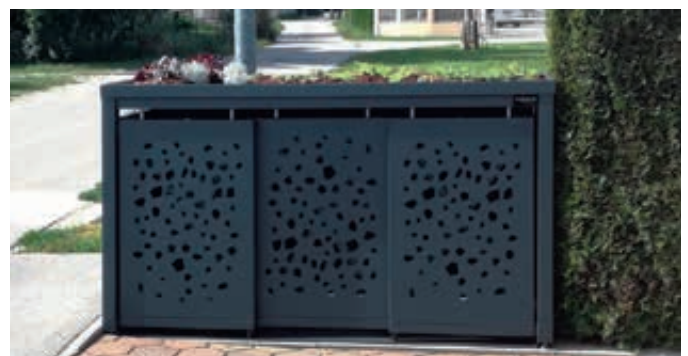
Müllbehälterschrank STYLEOUT® TOMO, Dreifachschrank, Stahlkonstruktion in RAL 7016 anthrazitgrau

• Internationaler Designschutz (EUIPO Registrierungsnummer 003076363-0002)