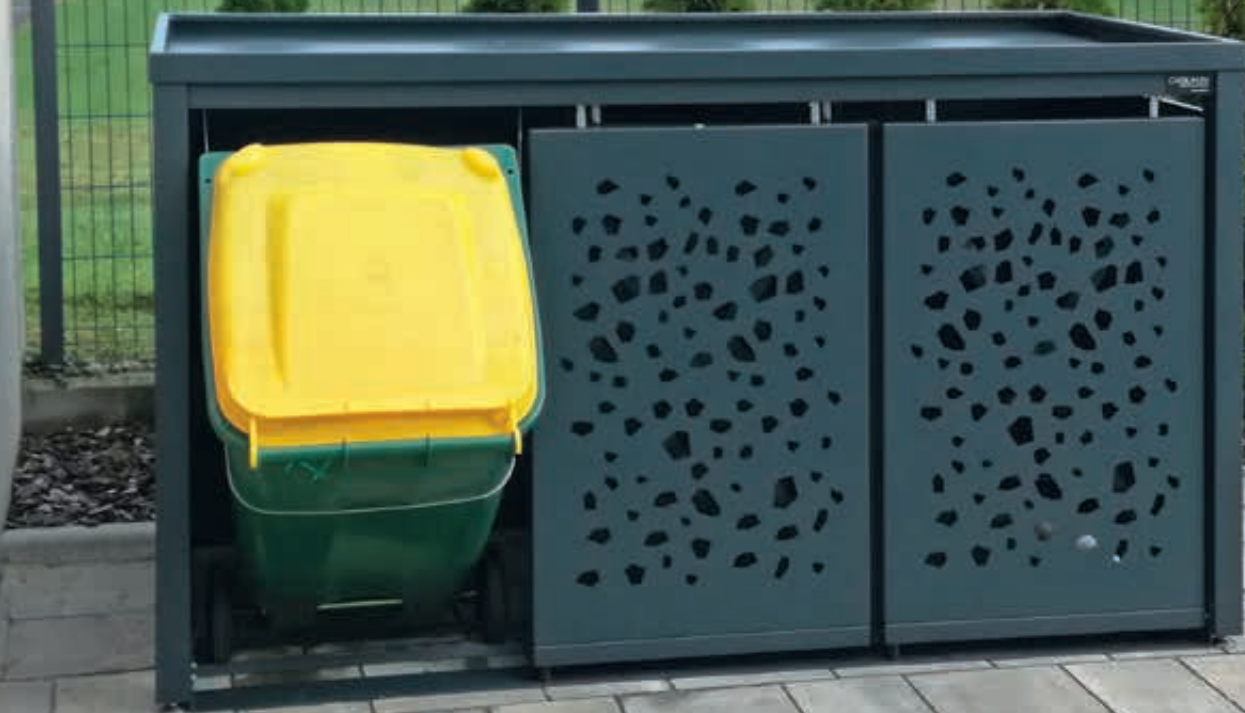
Müllbehälterschrank STYLEOUT® TOMO mit Pflanzdach, Dreifachschrank, Stahlkonstruktion in RAL 7016 anthrazitgrau