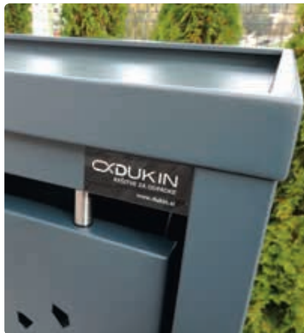
▲ Detail: Pflanzdach