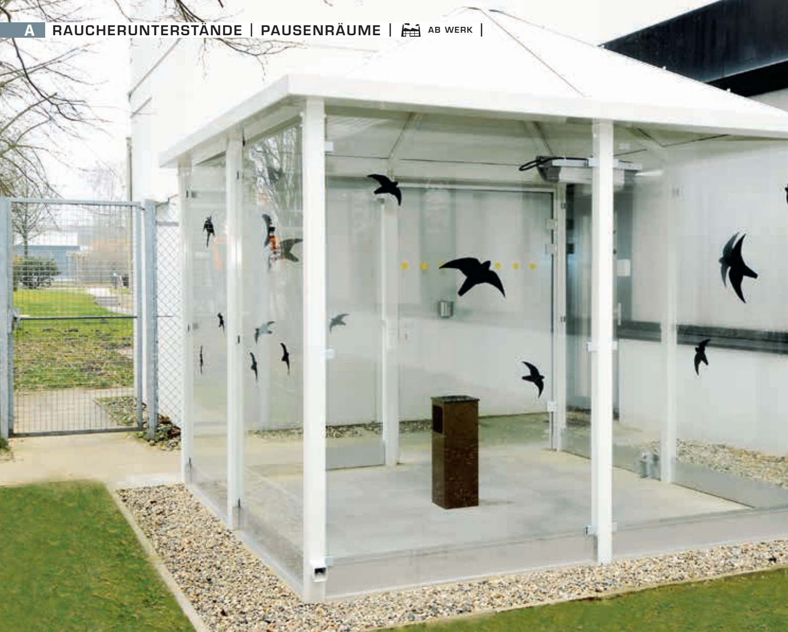
Einzel-Raucherunterstand APOLLO mit Blechdach, Dachbreite x Dachtiefe 3300 mm x 3300 mm, 7 Seitenwänden sowie Ganzglastür mit Raubvogelaufklebern, Stahlkonstruktion in RAL 9002 grauweiß