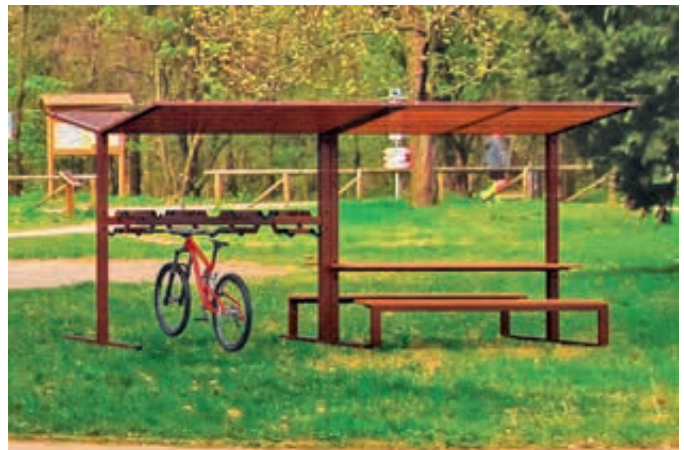
Fahrradüberdachung CISON in Verbindung mit Freizeitüberdachung CISON (auf Anfrage), Lamellendach aus Holz, 2 x Dachbreite 2100 mm x Dachtiefe 2491 mm, mit integriertem Lenkerhaltesystem, Stahlkonstruktion in RAL 8017 schokoladenbraun