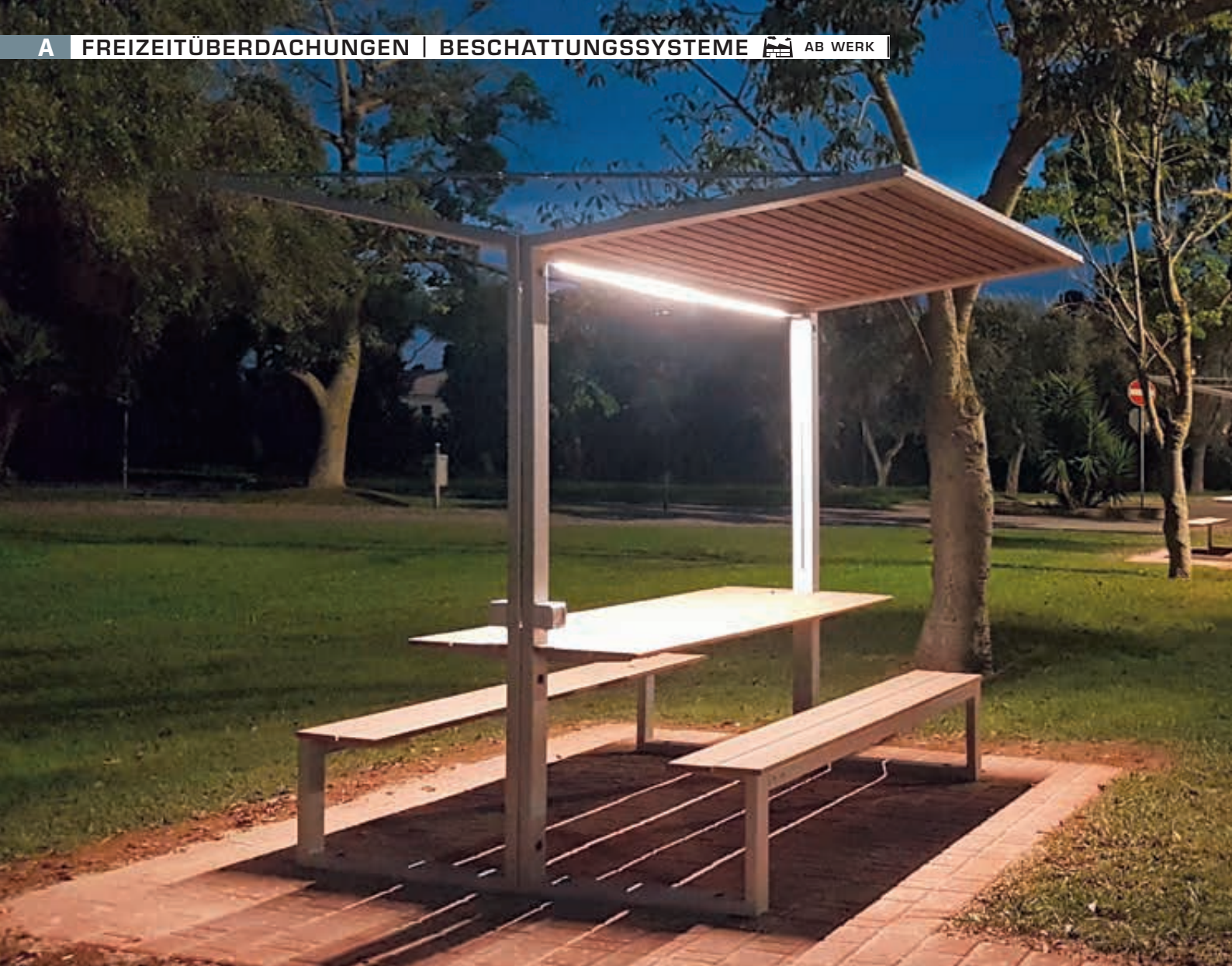
Freizeitüberdachung CISON, Lamellendach aus Holz, Dachbreite x Dachtiefe 2100 mm x 2491 mm, mit integriertem Tisch und Sitzbank, LED-Beleuchtung bauseits, Stahlkonstruktion in RAL 1013 perlweiß