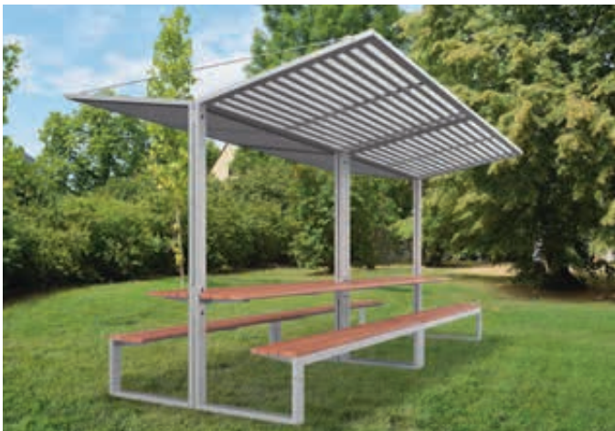
Freizeitüberdachung CISON, Lamellendach aus Stahl, 2 x Dachbreite 2100 mm x Dachtiefe 2491 mm, mit integriertem Tisch und Sitzbank, Stahlkonstruktion in RAL 9006 weißaluminium

Weitere Bilder, Informationen und Ausschreibungstexte: www.ziegler-metall.de H4788 🔍