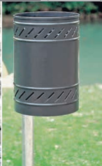
Abfallbehälter MAGGIOLINO mit Schutzdach, Behälter und Schutzdach in RAL 6005 moosgrün, feuerverzinkter Pfosten zum Einbetonieren