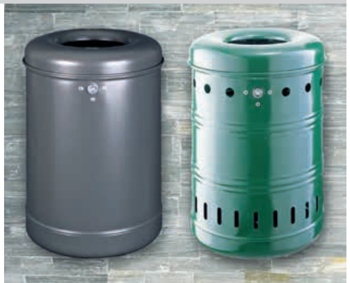
▲ Abfallbehälter BURNABY, Vollblech, in RAL 7016 anthrazitgrau ▲ Abfallbehälter BURNABY, mit Lochoptik, in RAL 6005 moosgrün