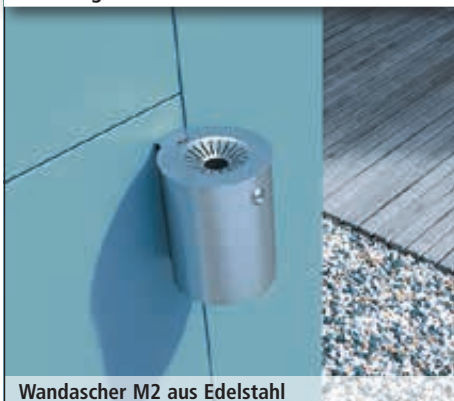
Wandascher M2 in RAL 7016 anthrazit