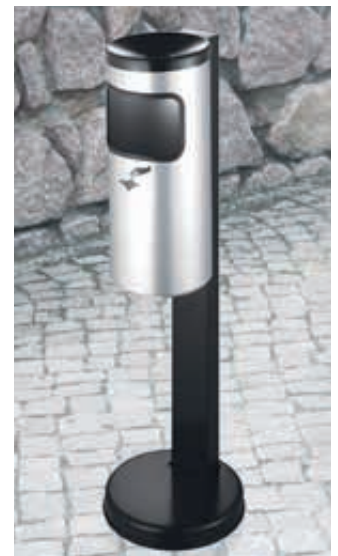
▲ Abfallbehälter GLASGOW mit Ascher, in weißaluminium ähnlich RAL 9006, mit Standfuß zum freien Aufstellen (Zubehör)