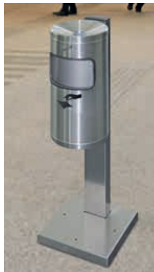
▲ Abfallbehälter GLASGOW mit Ascher, aus Edelstahl, mit Standfuß zum Aufdübeln (Zubehör)