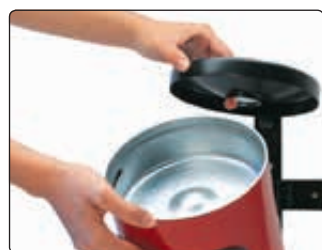
◀ Entleerung vom Abfallbehälter GLASGOW mit Ascher, in RAL 3001 signalrot, zur Wandbefestigung