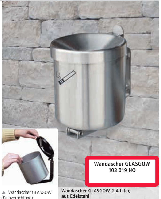
▲ Wandascher GLASGOW (Kippvorrichtung)