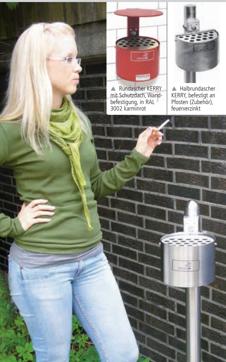
▲ Rundascher KERRY mit Schutzdach, Wandbefestigung, in RAL 3002 karminrot