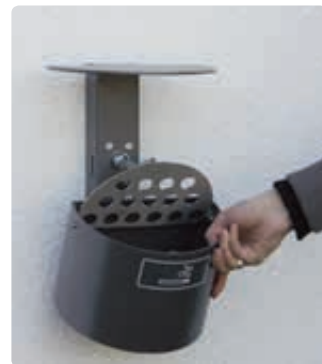
▲ Entleerung von Halbrundascher KERRY mit Schutzdach, Wandbefestigung, in DB 703 eisenglimmer