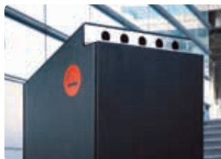
▲ Detail: Ascher

Abfallbehälter CRYSTAL finden Sie auf Seite 366.