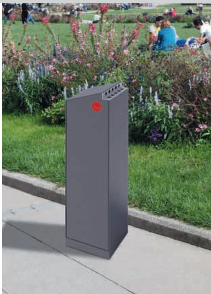
Standascher CRYSTAL, in DB 703 eisenglimmer, Siebdruck in RAL 3020 verkehrsrot