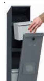
▲ Detail: Entleerung