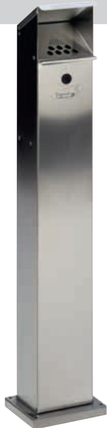
▲ Standascher WINDSOR aus Edelstahl