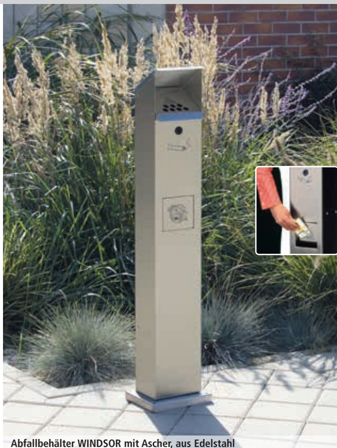
Abfallbehälter WINDSOR mit Ascher, aus Edelstahl