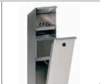
▲ Detail: Entleerung