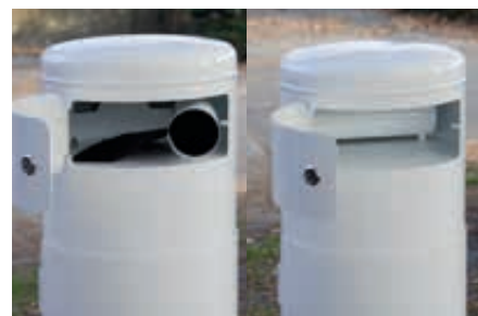
▲ Beutelspender befüllen

Weitere Hundetoiletten finden Sie online unter: www.ziegler-metall.de