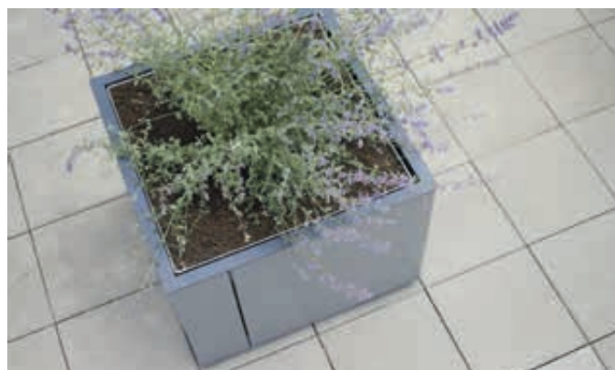
Pflanzbehälter MALAGENO, 700 x 700 mm, in RAL 9007 graualuminiem