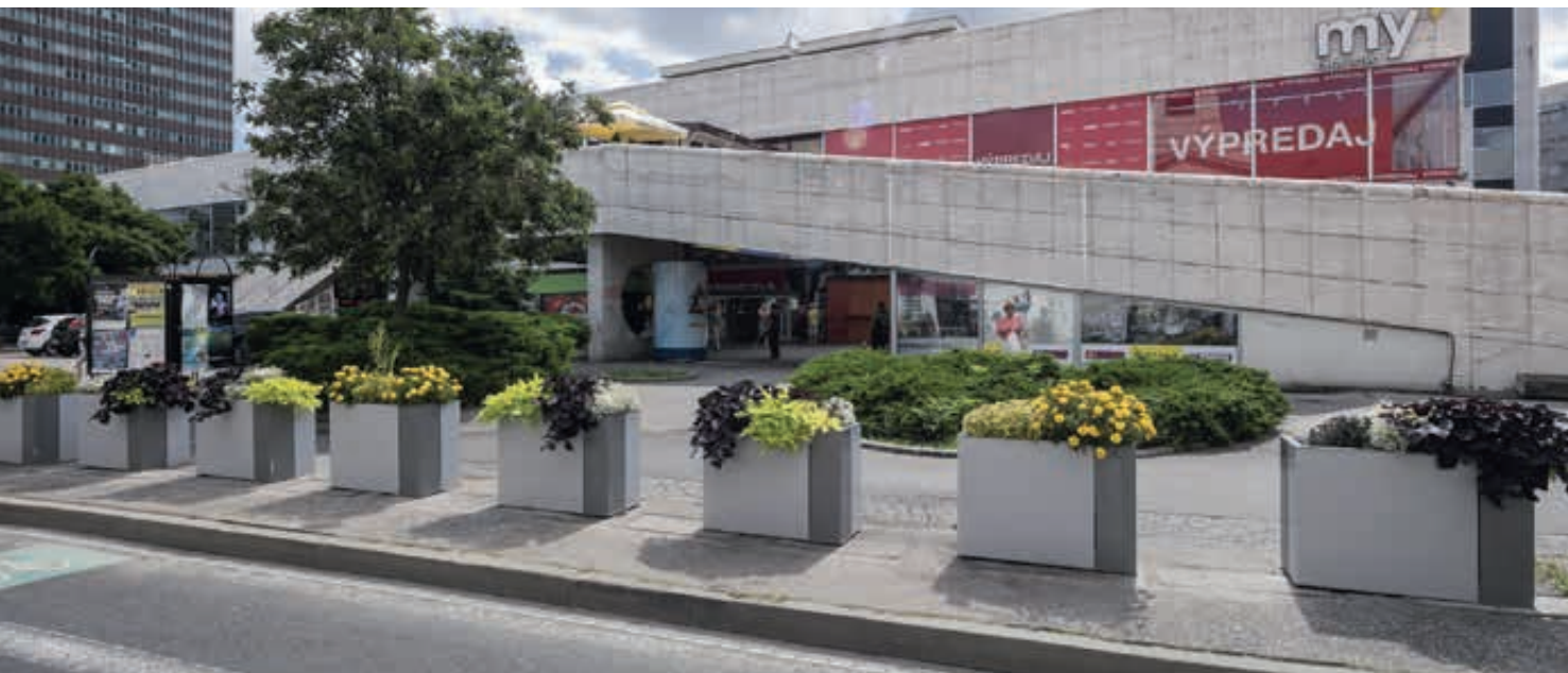
Pflanzbehälter MALAGENO, 1000 x 440 mm, in RAL 7035 lichtgrau und RAL 9007 graualuminiem (zweifarbzig auf Anfrage)