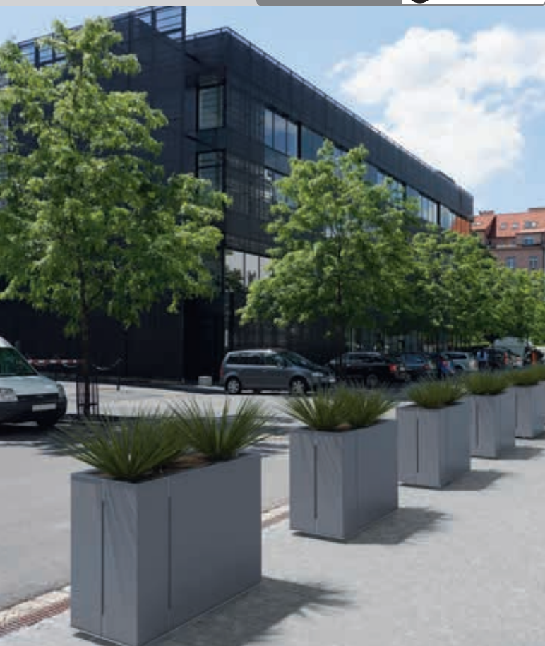
Pflanzbehälter MALAGENO, 1000 x 440 mm, in DB 703 eisenglimmer

Konstruktion: Robuster Pflanzbehälter bestehend aus einer Stahlrahmenkonstruktion mit überdeck gefalzten Seitenwänden aus Aluminium, einem Innenbehälter aus verzinktem Blech und verstellbaren Füßen (50 mm) zum Ausgleich von Bodenunebenheiten. Wahlweise ist der Pflanzbehälter mit einem Bewässerungssystem inkl. Wasserüberlauf erhältlich. Bei dem Pflanzbehälter ohne Bewässerungssystem befindet sich der Wasserablauf im Boden.