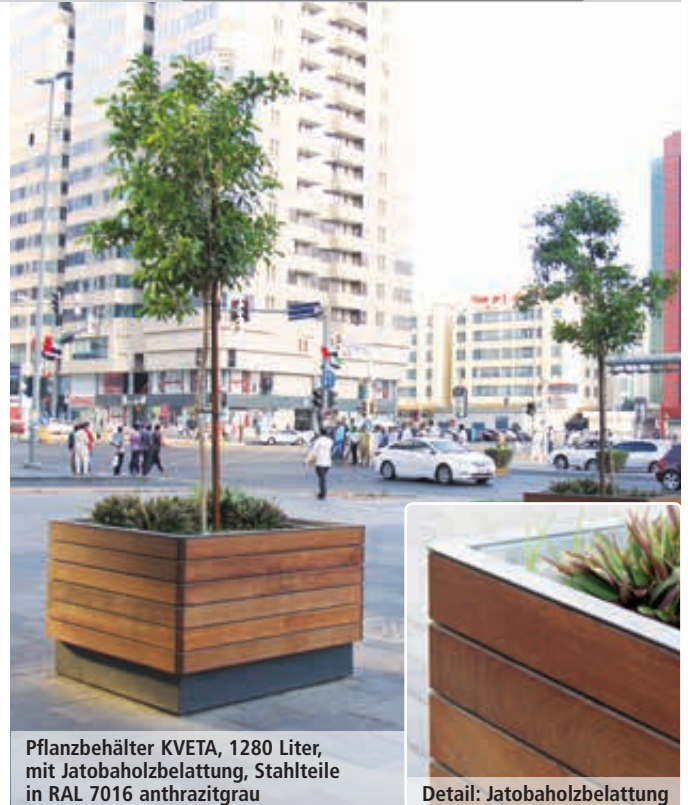
Pflanzbehälter KVETA, 1280 Liter, mit Jatobaholzbelattung, Stahlteile in RAL 7016 anthrazitgrau