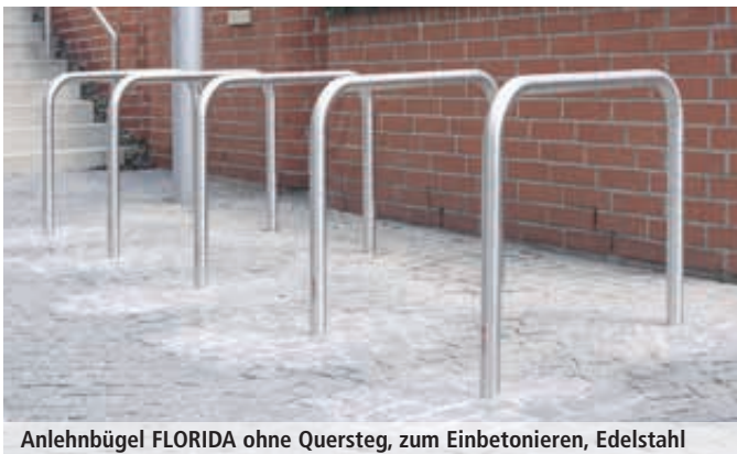
Anlehnbügel FLORIDA ohne Quersteg, zum Einbetonieren, Edelstahl