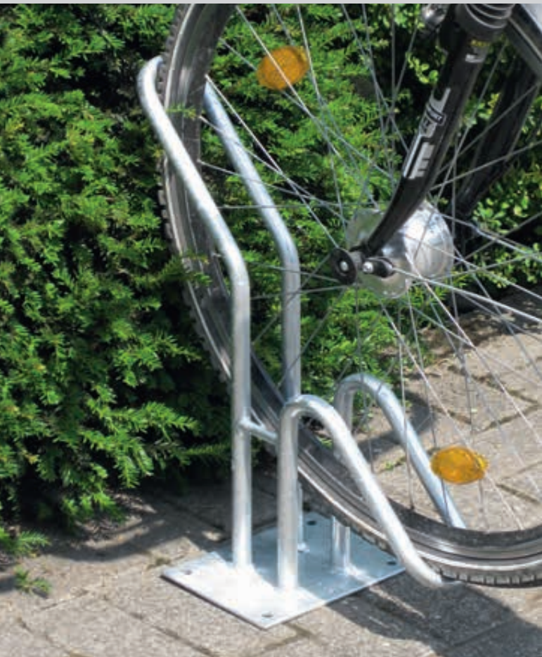
Einzelradständer HERVEY einseitig, tief, zum Aufdübeln, 1 Stellplatz

Konstruktion: Stabile Stahlkonstruktion. Radhalterung aus einem Stück gebogen, Rundrohr (Ø 20 mm). Einstellwinkel 45° und 90°. Einzelradständer in Einstellung tief bzw. hoch, Reihenradständer in tief bzw. hoch / tief. Radeinstellung 45° und 90°. 4 Stellplätze bestehen aus zwei 2er-Einheiten, 6 Stellplätze aus zwei 3er-Einheiten, 8 Stellplätze aus zwei 4er-Einheiten und 12 Stellplätze aus zwei 6er-Einheiten.