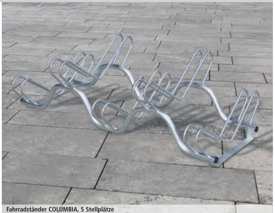
Fahrradständer COLUMBIA, 5 Stellplätze

Befestigungsart: Zum freien Aufstellen oder zum Aufdübeln bei +/- 0 mm, Befestigungsmaterial siehe Zubehör.