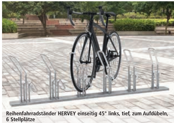
Reihenradständer HERVEY einseitig 45° links, tief, zum Aufdübeln, 6 Stellplätze