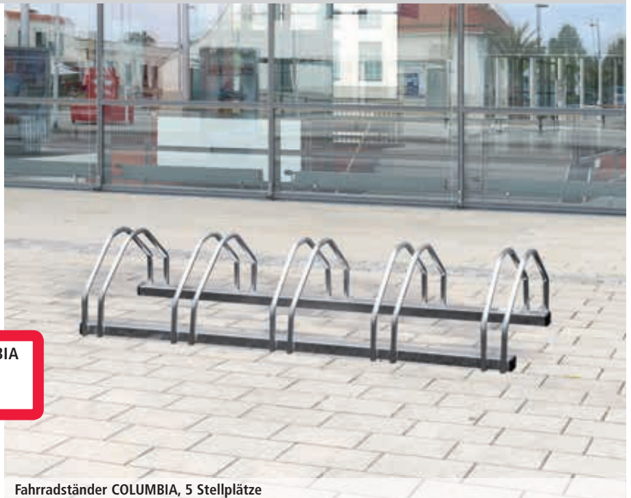
Fahrradständer COLUMBIA, 5 Stellplätze