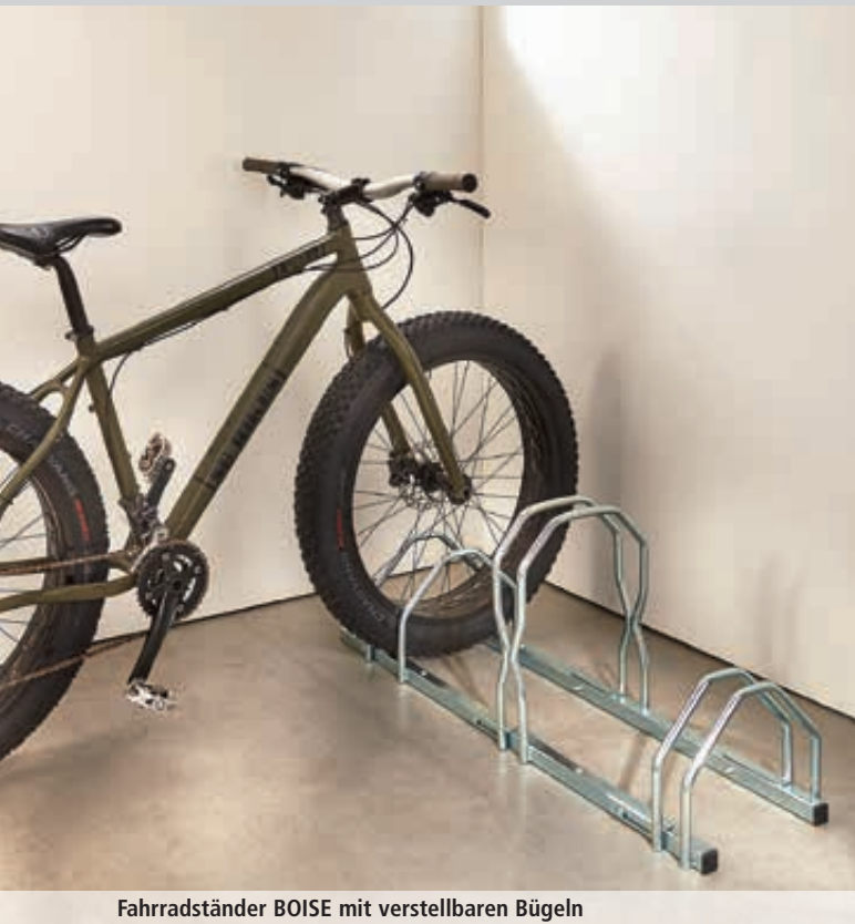
Fahrradständer BOISE mit verstellbaren Bügeln