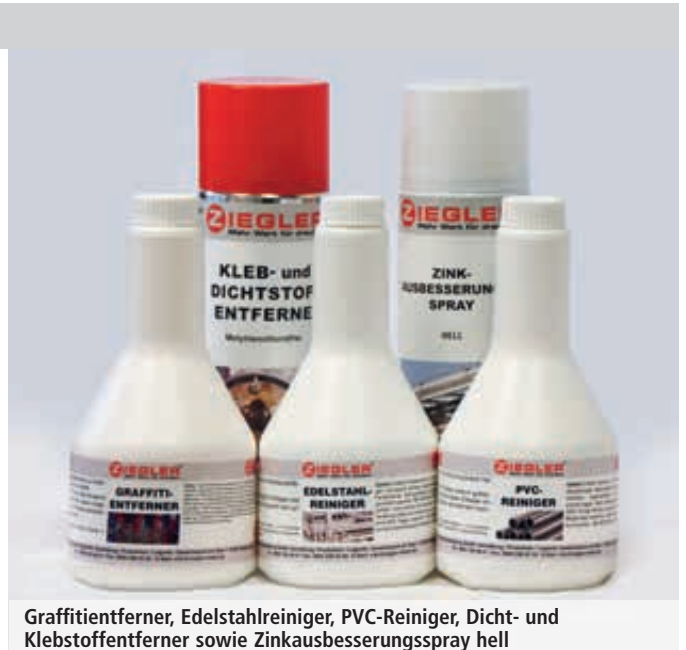
Graffiti-entferner, Edelstahlreiniger, PVC-Reiniger, Dicht- und Klebstoffentferner sowie Zinkausbesserungsspray hell

Graffiti-entferner: Zur Entfernung von Spraylacken auf Metallen, Glas, Keramik sowie harten Kunststoffen (flüssig und CKW-frei).