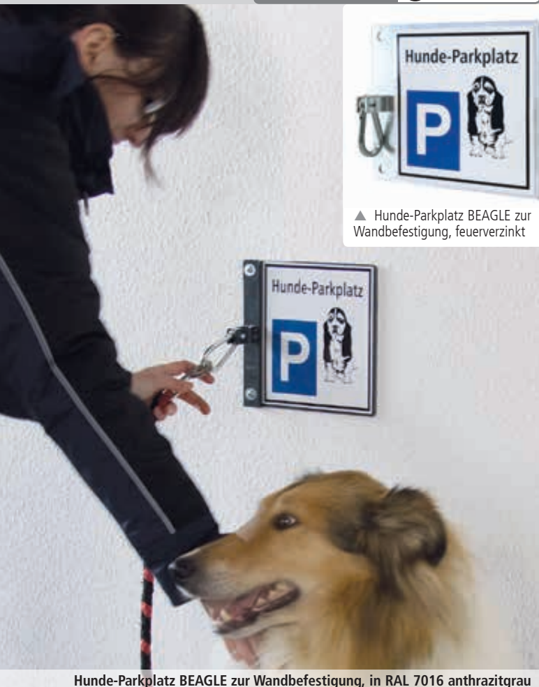
Hunde-Parkplatz BEAGLE zur Wandbefestigung, in RAL 7016 anthrazitgrau