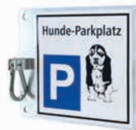
▲ Hunde-Parkplatz BEAGLE zur Wandbefestigung, feuerverzinkt