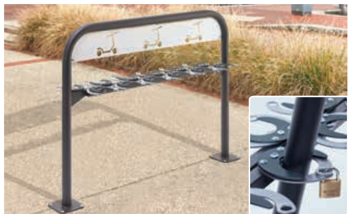
Scooter-Parker MANILA doppelseitig, zum Aufdübeln