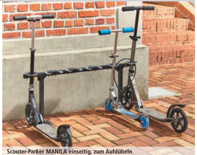
Scooter-Parker MANILA einseitig, zum Aufdübeln