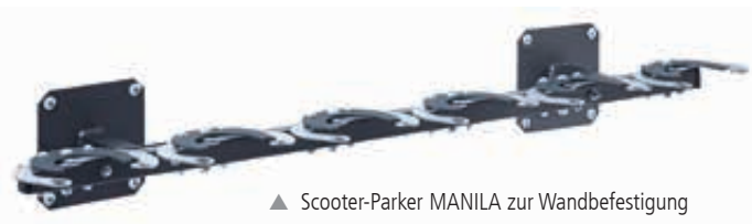
▲ Scooter-Parker MANILA zur Wandbefestigung