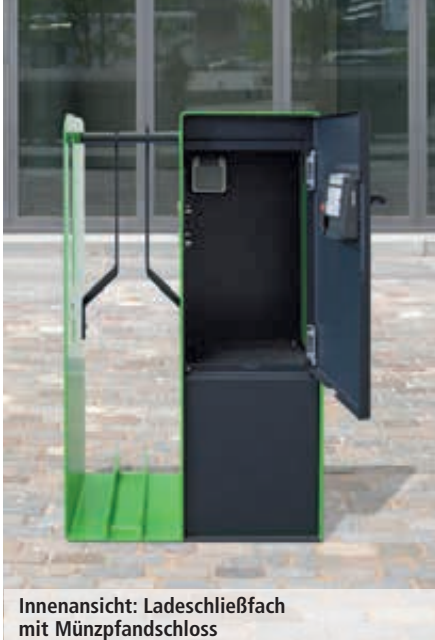
Innenansicht: Ladeschließfach mit Münzpfandschloss