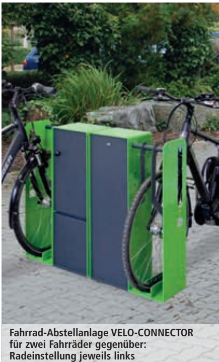
Fahrrad-Abstellanlage VELO-CONNECTOR für zwei Fahrräder gegenüber: Radeinstellung jeweils links

Weitere Bilder, Informationen und Ausschreibungstexte: www.ziegler-metall.de