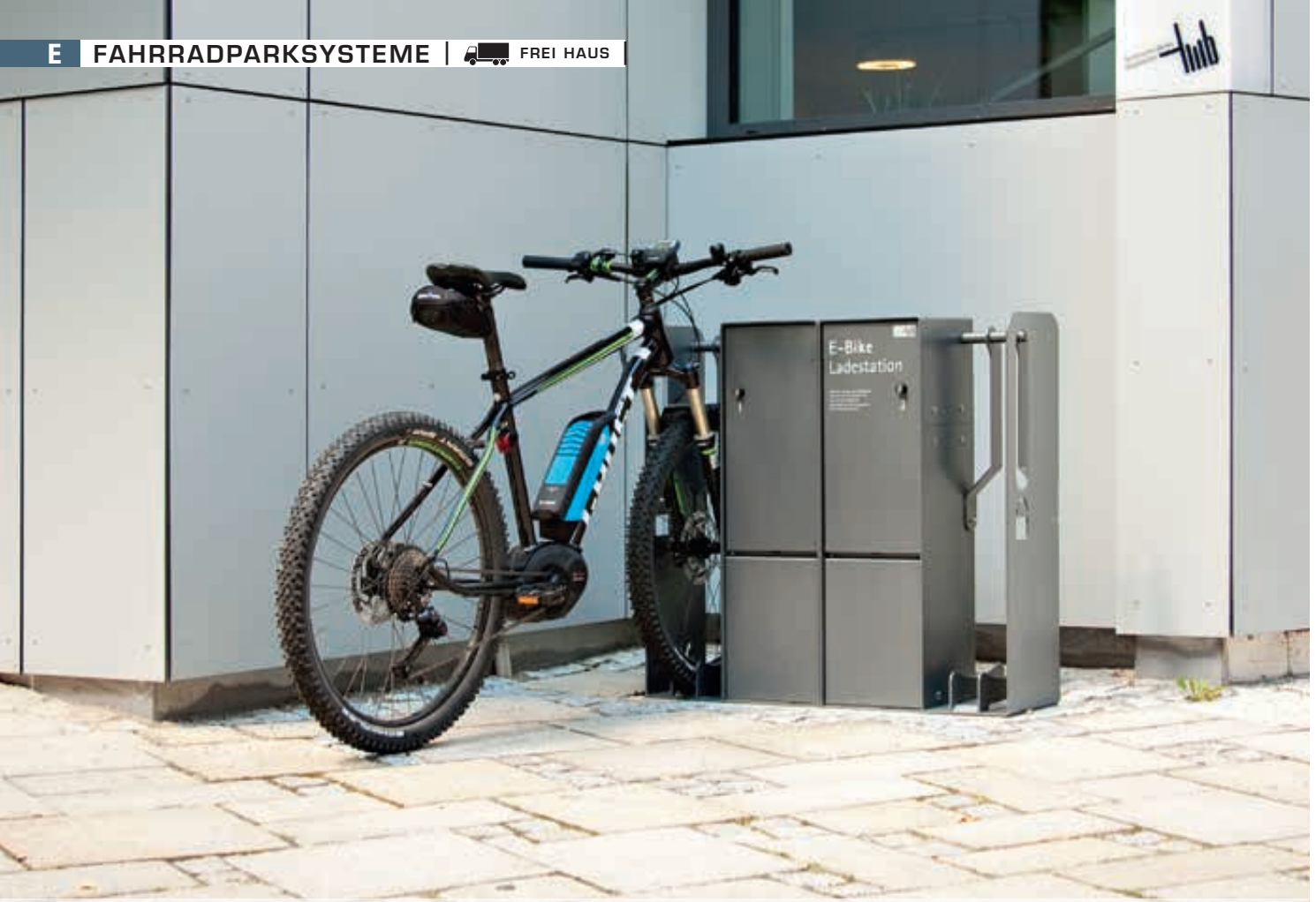
Fahrrad-Abstellanlage VELO-CONNECTOR mit Ladeschließfach, für Radeinstellung links bzw. rechts, Stahlteile in DB 703 eisenglimmer