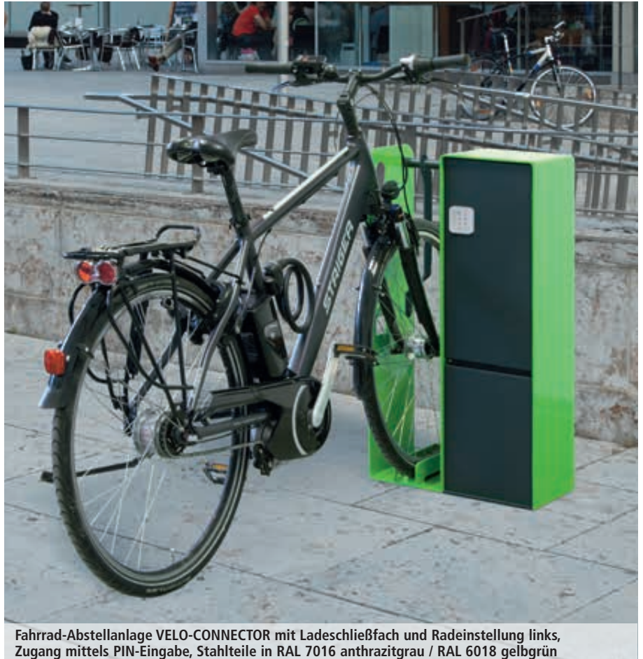
Fahrrad-Abstellanlage VELO-CONNECTOR mit Ladeschließfach und Radeinstellung links, Zugang mittels PIN-Eingabe, Stahlteile in RAL 7016 anthrazitgrau / RAL 6018 gelbgrün

- jetzt auch mit PIN-Code-Schließung erhältlich