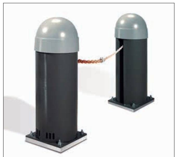
▲ Komplet-Set bestehend aus Säule mit integriertem Motor und Steuerung, Säule mit Gegengewicht und Abwickleinheit, Kette bis 7 m bzw. 15 m je Modell