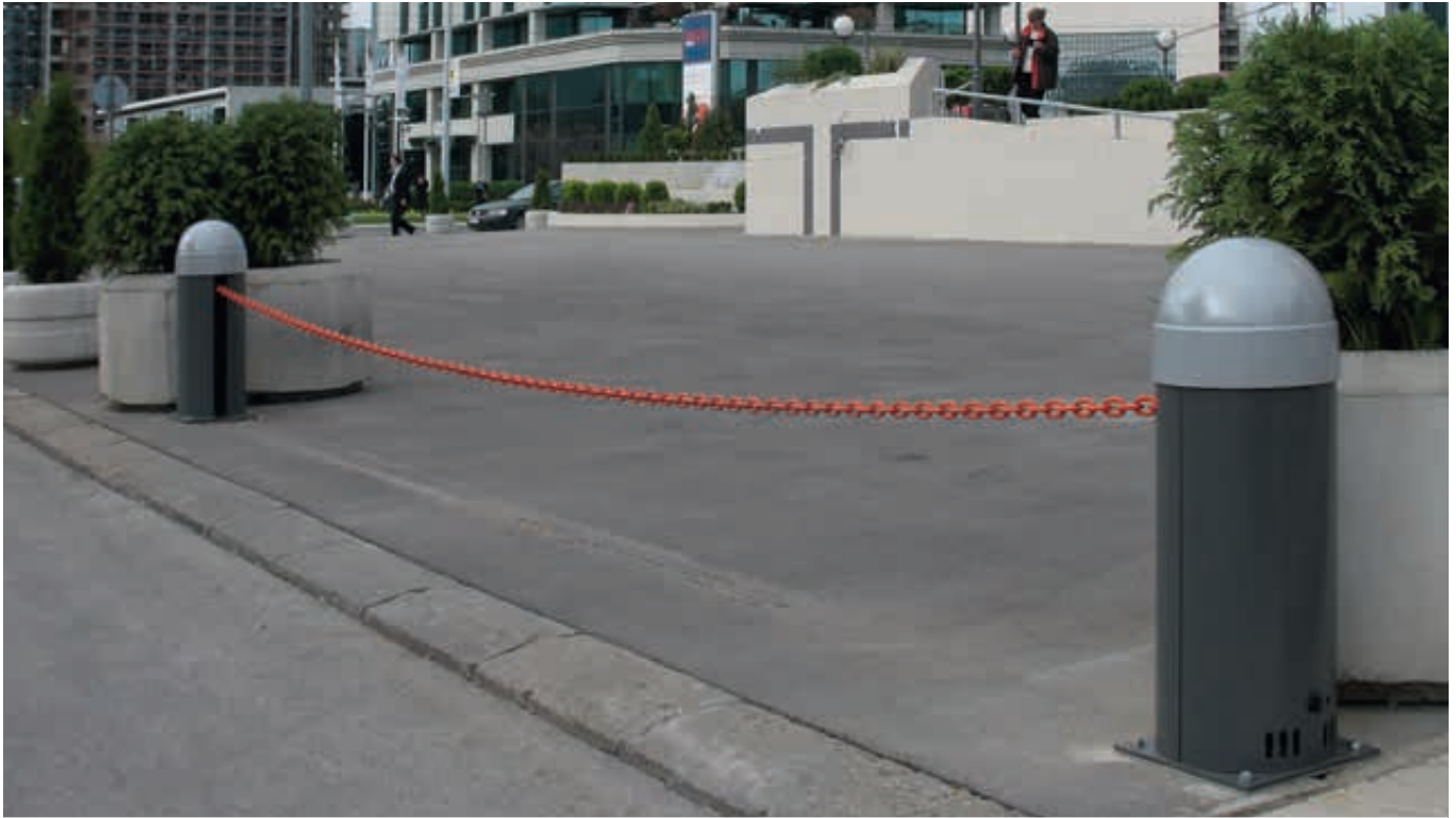
Kettenabsenker LOGQUES, in RAL 7016 anthrazitgrau, Pollerkopf in RAL 7035 lichtgrau, Absperrbreite 7 m