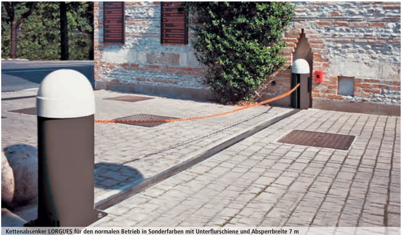
Kettenabsenker LORGUES für den normalen Betrieb in Sonderfarben mit Unterflurschiene und Absperrbreite 7 m