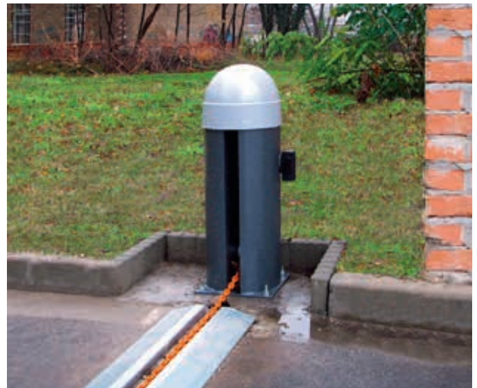
Kettenabsenker LOGQUES mit Infrarotschranke und Überflurschiene

*Für den Einbau dieser Bedienelemente wird eine Bediensäule benötigt.