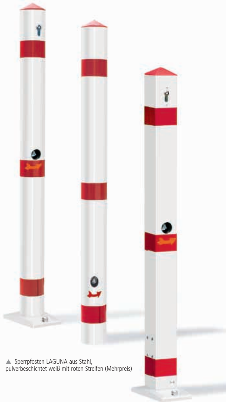
▲ Sperrposten LAGUNA aus Stahl, pulverbeschichtet weiß mit roten Streifen (Mehrpreis)