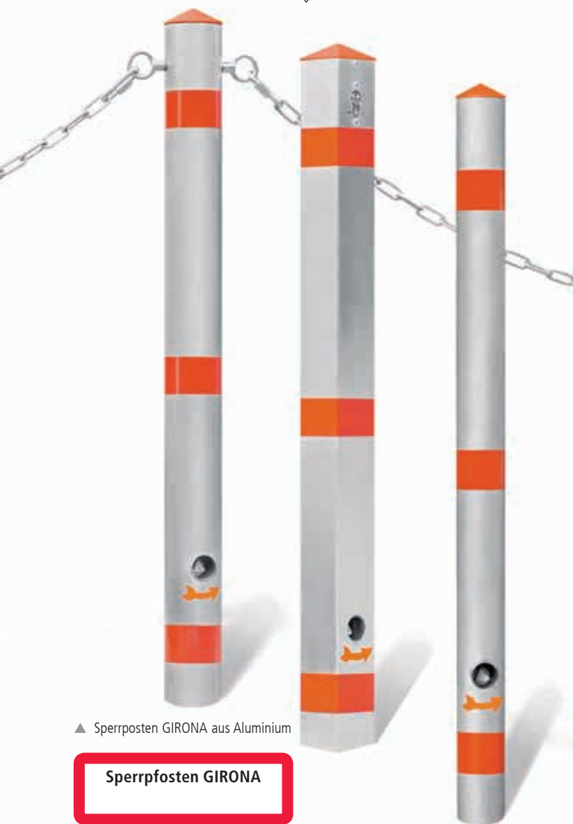
▲ Sperrposten GIRONA aus Aluminium

Absperrketten und Verbindungsglieder finden Sie auf Seite 526.