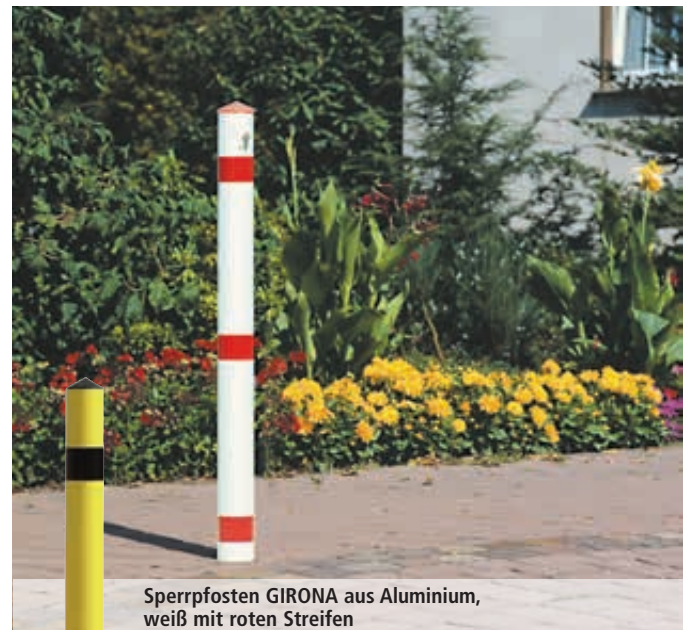
Sperrpfosten GIRONA aus Aluminium, weiß mit roten Streifen

Sperrpfosten gelb pulverbeschichtet mit schwarzen Reflexstreifen für den Innenbereich finden Sie auf Seite 600.