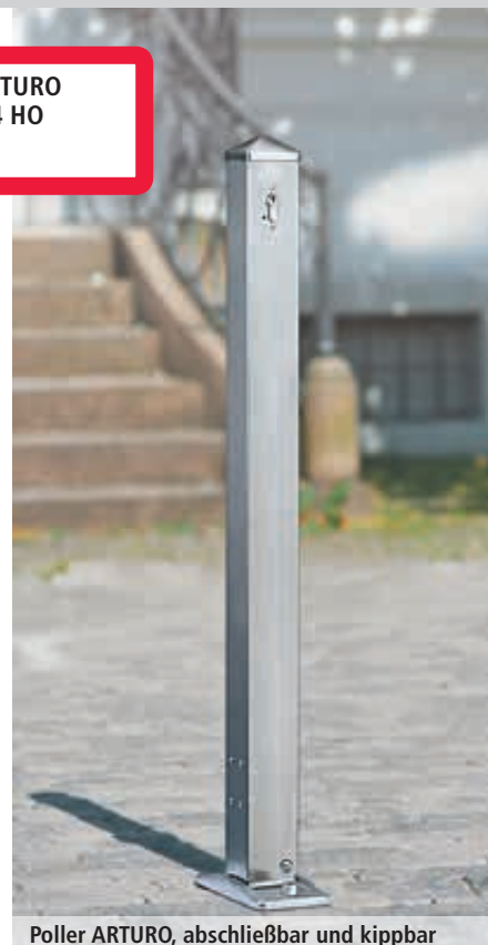
Poller ARTURO, abschließbar und kippbar