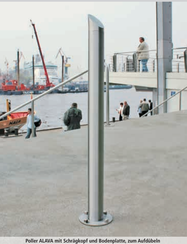
Poller ALAVA mit Schrägkopf und Bodenplatte, zum Aufdübeln

Konstruktion: Poller aus Edelstahl mit glatter und porenfreier Oberfläche.