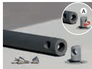
A - Neues Verbindungsstück in Bodenhülse einsetzen und um 90° drehen

ausgezeichnet durch das Design Zentrum NRW mit dem „reddot“ für hohe Designqualität