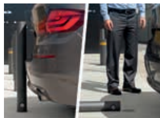
Das austauschbare Verbindungsstück bricht an der Sollbruchstelle (hier: Standardausführung ohne Wegrollsicherung).