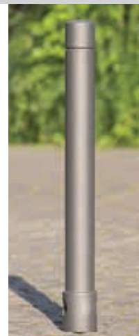
▲ Poller TARANIS mit einer Rille in DB 703 eisenglimmer