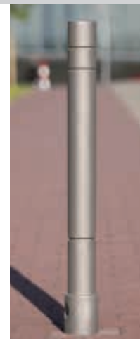
▲ Poller TARANIS mit drei Rillen in DB 703 eisenglimmer