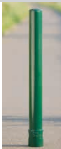
▲ Poller TARANIS ohne Rille in RAL 6009 tannengrün

Befestigungsart: Zum Einbetonieren (empfohlene Einbautiefe 300 mm). 3p-Technologie (herausnehmbar aus Bodenhülse): bestehend aus Bodenhülse 300 mm, Verbindungsstück mit Sollbruchstelle (ohne Wegrollversicherung), Spannkegel ohne Innengewinde, Spannkegel mit Innengewinde und 6-Kantschraube.