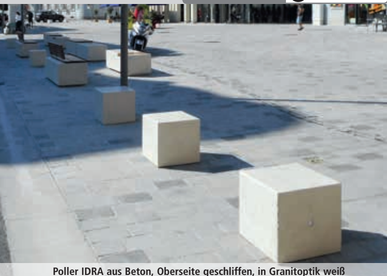
Poller IDRA aus Beton, Oberseite geschliffen, in Granitoptik weiß

Konstruktion: Poller aus Beton bzw. Marmor mit einer Stahlbewehrung verstärkt. Alle Kanten sind abgerundet.