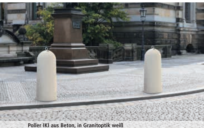
Poller IKI aus Beton, in Granitoptik weiß