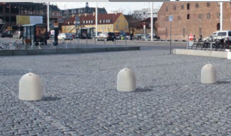
Poller TIP aus Beton, in Granitoptik weiß

Konstruktion: Poller aus Beton bzw. Marmor mit abschraubbarer Öse, zur Befestigung an Masten, Stangen, Halbröhren, Stäben, Ketten (siehe Zubehör).