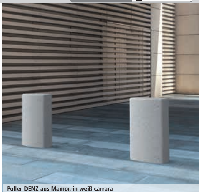
Poller DENZ aus Marmor, in weiß carrara