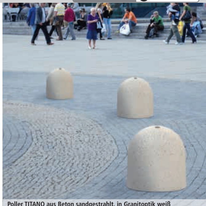
Poller TITANO aus Beton sandgestrahlt, in Granitoptik weiß

Standardfarben Marmor für diese Doppelseite - bitte bei Bestellung Farbe angeben!