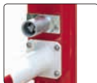
▲ DK (SIMPLEX)