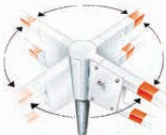
▲ bei 90° automatisch einrastend