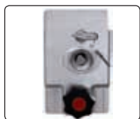
▲ Schlosskasten mit PZ und DK