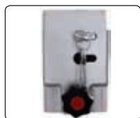
▲ Schlosskasten mit PZ und Blind-PZ-Einsatz

Befestigungsart: Zum Einbetonieren (empfohlene Einbautiefe 500 mm) bzw. Aufdübeln bei +/- 0 mm mit Bodenplatte (250 x 250 mm), Befestigungsmaterial siehe Zubehör.