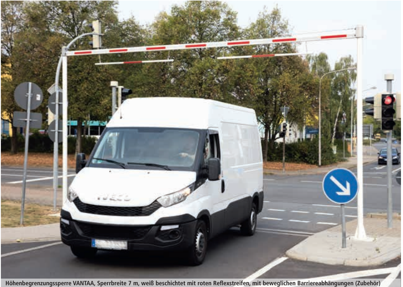
Höhenbegrenzungssperre VANTAA, Sperrbreite 7 m, weiß beschichtet mit roten Reflexstreifen, mit beweglichen Barriereabhängungen (Zubehör)