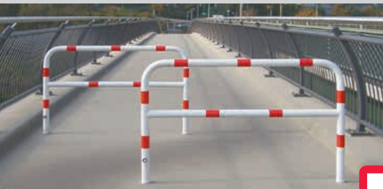
Sperrzaun VIHTI, verschließbar, feuerverzinkt und weiß pulverbeschichtet mit roten Reflexstreifen