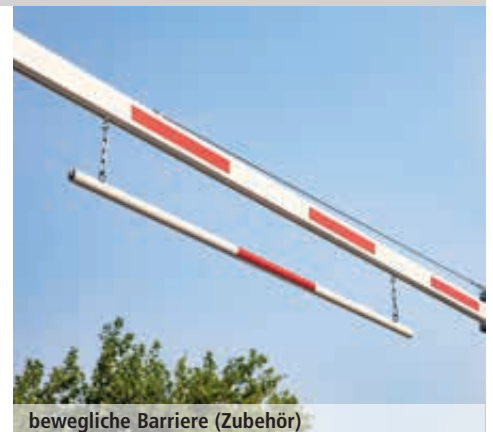
bewegliche Barriere (Zubehör)