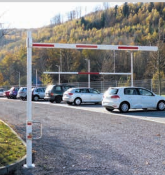
Höhenbegrenzungssperre RAUMO, drehbar, mit beweglicher Barriere, Sperrbreite 3,00 m

Konstruktion: Horizontal drehbare, alle 90° verriegelbare und ab 1000 mm stufenlos verstellbare Höhenbegrenzungssperre. Bestehend aus einer Hauptstütze aus Stahlrohr (Ø 102 mm), einem Drehbügel aus Edelstahl und einem Aluminium-Sperrbalken (86 x 46 mm) mit Antisitzschutz und Seilzugverstärkung. Lichte Durchfahrts Höhe bis maximal 2800 bzw. 3800 mm. Barrierenabhängung aus Aluminium siehe Zubehör. Auf Anfrage mit Auflagestütze.