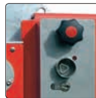
▲ Schlosskasten mit Feuerwehdreikant und Profilhalbzylinder für Hauptstütze

Befestigungsart: Zum Einbetonieren, empfohlenes Fundament der Hauptstütze L x B x H 600 x 600 x 800 mm, empfohlenes Fundament der Auflagesstütze L x B x H 400 x 400 x 600 mm bzw. zum Aufdübeln bei +/- 0 mm mit Fußplatte (Hauptstütze L x B 400 x 270 mm, Auflagesstütze L x B 200 x 200 mm). Befestigungsmaterial siehe Zubehör.