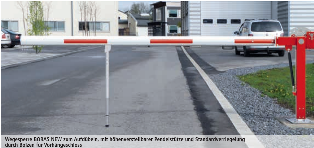
Wegesperre BORAS NEW zum Aufdübeln, mit höhenverstellbarer Pendelstütze und Standardverriegelung durch Bolzen für Vorhängeschloss