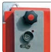
▲ Schlosskasten mit Feuerwehdreikant und Profilhalbzylinder für Hauptstütze

Befestigungsart: Zum Einbetonieren, empfohlenes Fundament der Hauptstütze L x B x H 600 x 600 x 800 mm, empfohlenes Fundament der Auflagestütze L x B x H 400 x 400 x 600 mm bzw. zum Aufdübeln bei +/- 0 mm mit Fußplatte (Hauptstütze L x B 400 x 270 mm, Auflagestütze L x B 200 x 200 mm). Befestigungsmaterial siehe Zubehör.