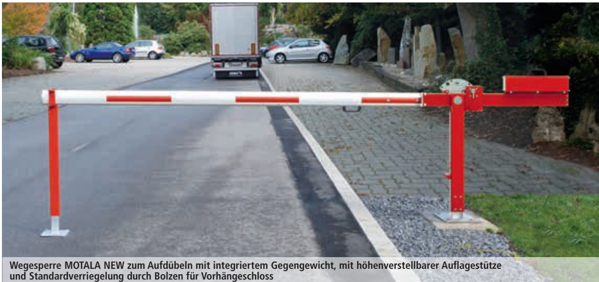
Wegesperre MOTALA NEW zum Aufdübeln mit integriertem Gegengewicht, mit höhenverstellbarer Auflagesstütze und Standardverriegelung durch Bolzen für Vorhängeschloss