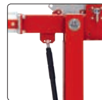
▲ Detail: Gasdruckfeder