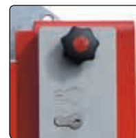
▲ Schlosskasten mit Profilhalbzylinderschloss und Blind-PZ-Einsatz (siehe Zubehör)