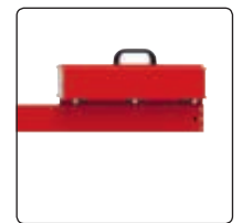
▲ Detail: Gegengewicht