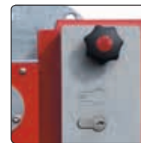
▲ Schlosskasten mit Profilhalbzylinderschloss und Blind-PZ-Einsatz (siehe Zubehör)