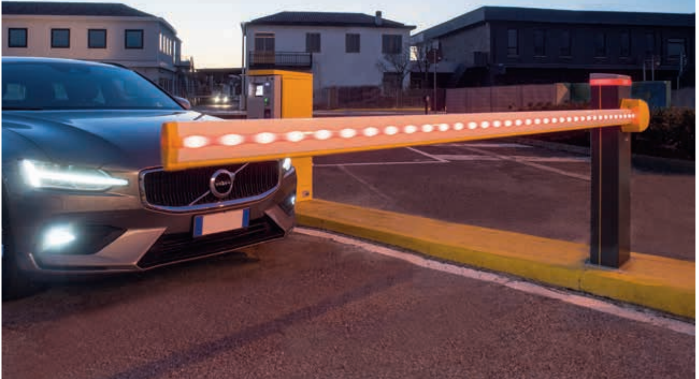
Schrankenanlage MONNES für hohe Nutzung