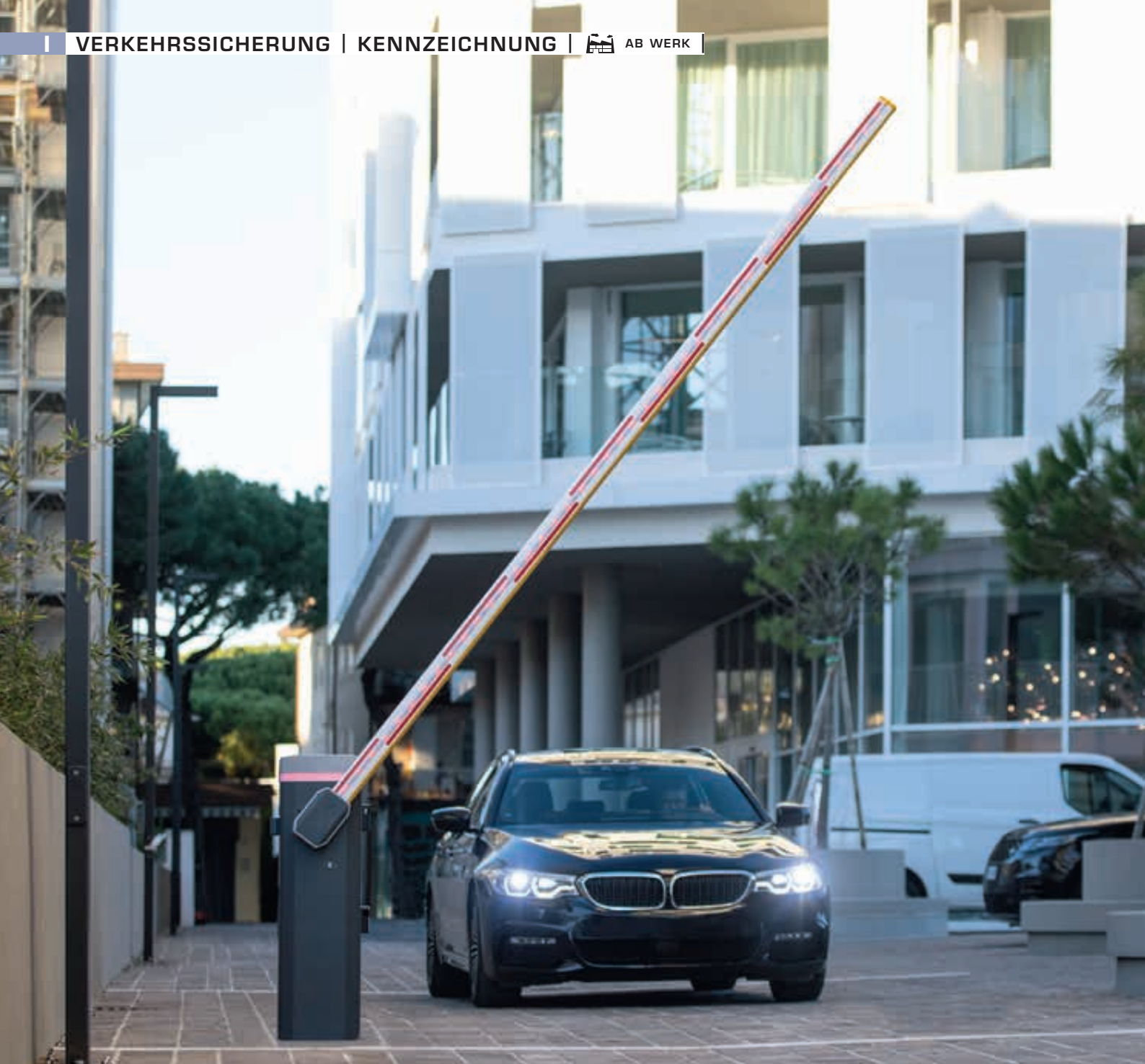
Schrankenanlage BUSSET, Absperrbreite 4,00 m, mit LED-Schrankenbaumbeleuchtung (Zubehör)