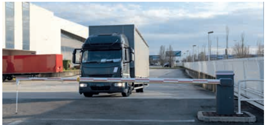
Schrankenanlage BUSSET, Absperrbreite 7,60 m mit 4 + 4 m Teleskop-Schrankenbaum mit Pendelstütze, mit LED-Schrankenbaumbeleuchtung (Zubehör)