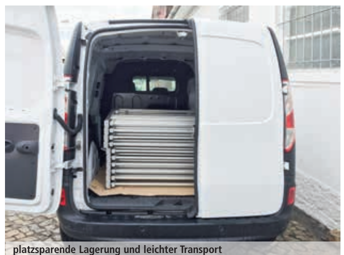
platzsparende Lagerung und leichter Transport