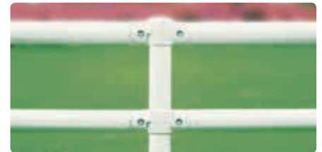
▲ lackiert in RAL 9016 verkehrsweiß