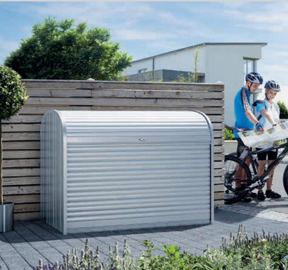
Universal-Depot STOREMAX® in silber-metallic, Modell 190 für 3 Müllgroßbehälter

Konstruktion: Rollläden (zweigeteilt, mit Federunterstützung) und Führungsprofile aus Aluminium. Rückwand, Seitenwände, Rollladenabschlussprofile und Boden aus Stahlblech. Mit Werkzeughalter an den Innenseiten der Seitenwände und der Rückwand. Regal-Sets und Zwischenböden in verschiedenen Ausführungen siehe Zubehör. Fahrradständer-Set auf Anfrage.