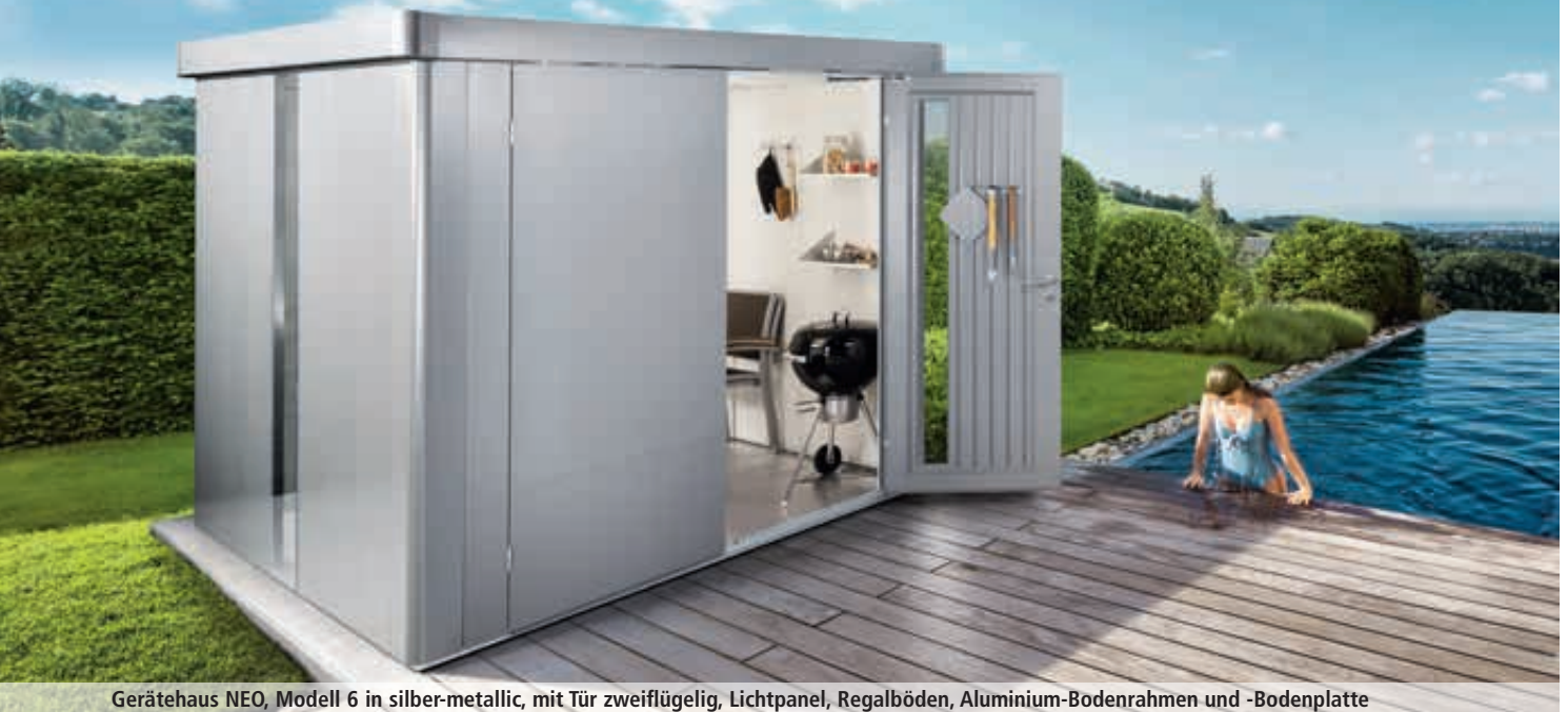
Gerätehaus NEO, Modell 6 in silber-metallic, mit Tür zweiflügelig, Lichtpanel, Regalböden, Aluminium-Bodenrahmen und -Bodenplatte