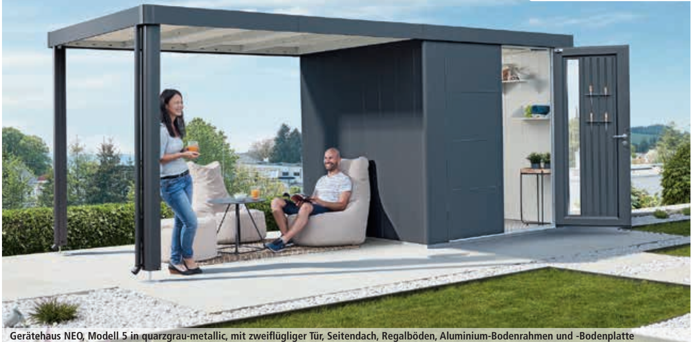
Gerätehaus NEO, Modell 5 in quarzgrau-metallic, mit zweiflügliger Tür, Seitendach, Regalböden, Aluminium-Bodenrahmen und -Bodenplatte