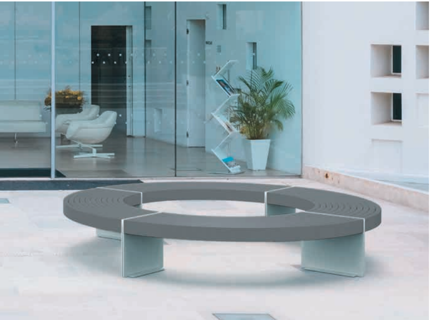
Sitzbank LENI gebogen, in DB 703 eisenglimmer und RAL 9006 weißaluminium (zweifarbige auf Anfrage)