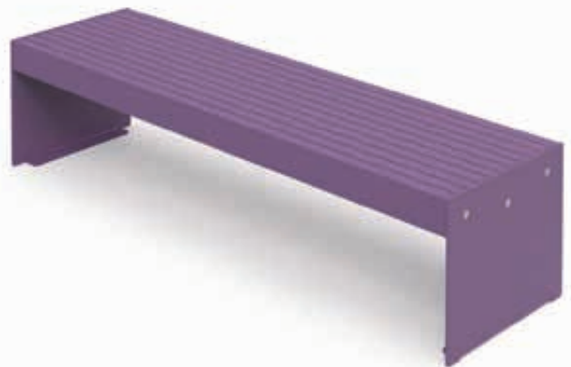
▲ Sitzbank LENI ohne Rückenlehne, in RAL 4005 blaulila