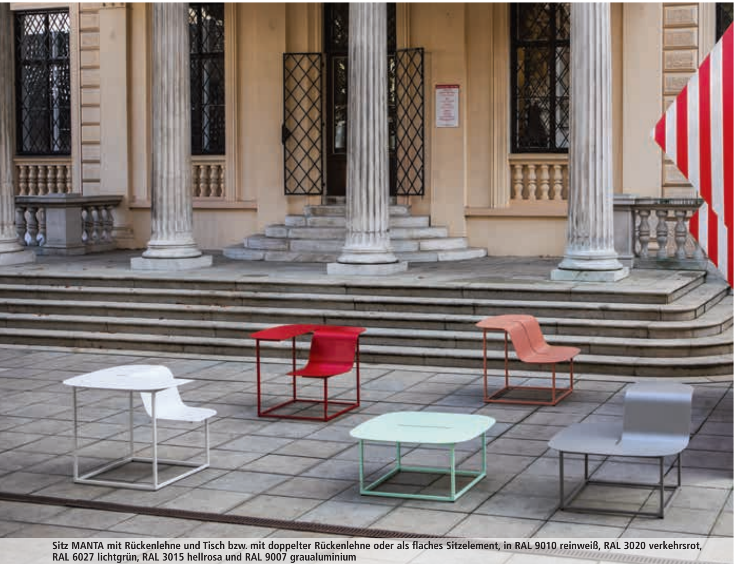
Sitz MANTA mit Rückenlehne und Tisch bzw. mit doppelter Rückenlehne oder als flaches Sitzelement, in RAL 9010 reinweiß, RAL 3020 verkehrsrot, RAL 6027 lichtgrün, RAL 3015 hellrosa und RAL 9007 graualuminium