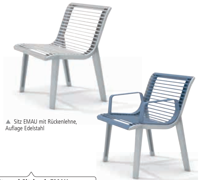
▲ Sitz EMAU mit Rückenlehne, Auflage Edelstahl