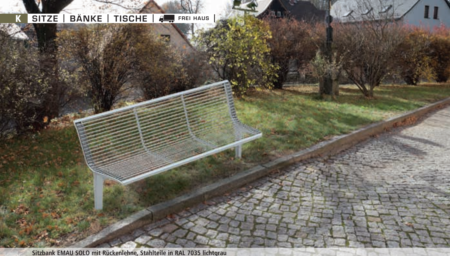
Sitzbank EMAU SOLO mit Rückenlehne, Stahlteile in RAL 7035 lichtgrau