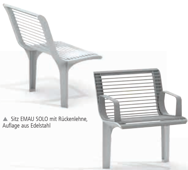
▲ Sitz EMAU SOLO mit Rückenlehne, Auflage aus Edelstahl