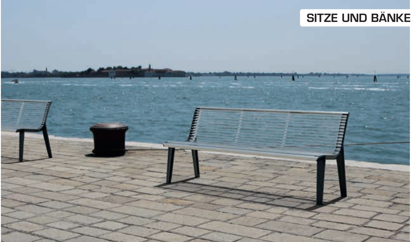
Sitzbank EMAU mit Rückenlehne, Auflage Edelstahl, Unterkonstruktion in RAL 7016 anthrazitgrau (auf Anfrage)