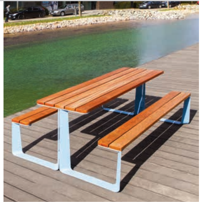
Bank-Tisch-Kombination RAUTSTER, doppelseitig, mit Jatobaholzbelattung, Stahlteile in RAL 5024 pastellblau