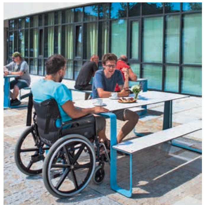
Bank-Tisch-Kombination RAUTSTER, einseitig barrierefrei, mit HPL-Auflage in White 0085, Stahlteile in RAL 5015 himmelblau