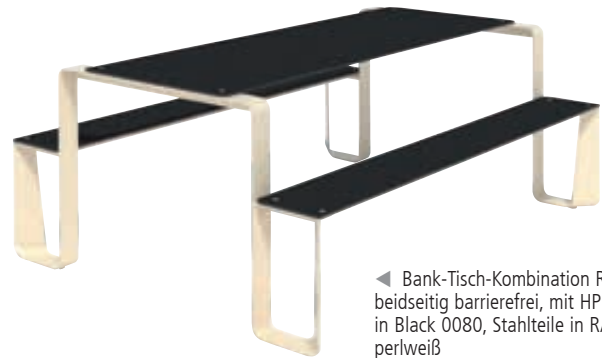
◀ Bank-Tisch-Kombination RAUTSTER, beidseitig barrierefrei, mit HPL-Auflage in Black 0080, Stahlteile in RAL 1013 perlweiß

Weitere Ausführungen finden Sie online unter: www.ziegler-metall.at