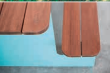
Bank-Tisch-Kombination WAVER mit Sapeliholzbelattung, Stahlteile in RAL 5010 enzianblau

◀ Bank-Tisch-Kombination WAVER mit Sapeliholzbelattung, Stahlteile in RAL 5021 wasserblau