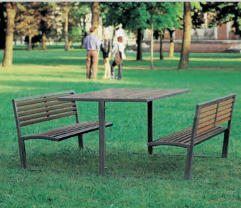
Bank-Tisch-Kombination CAMILLA, Stahlteile in RAL 7016 anthrazitgrau

Konstruktion: Tisch und Sitzbänke sind konstruktiv fest miteinander verbunden. Die gesamte Konstruktion ist 2-teilig verschraubt und besteht aus 30 x 30 mm Quadratrohr. Tischplatte sowie Sitzfläche und Rückenlehne mit Holzbelattung.