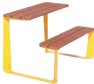
◀ Bank-Tisch-Kombination RAUTSTER, einseitig, Breite 1200 mm, mit Jatobaholzbelattung, Stahlteile in RAL 1021 rapsgeblau