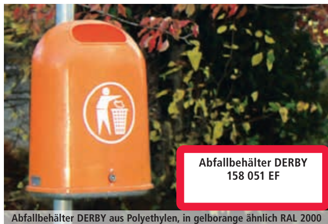
Abfallbehälter DERBY 158 051 EF