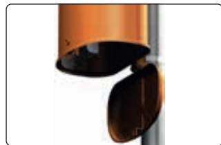
▲ Detail: Bodenklappe zur Entleerung geöffnet