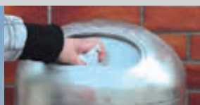
▲ Detail: Federeinwurfklappe z. B. gegen Eindringen von Vögeln