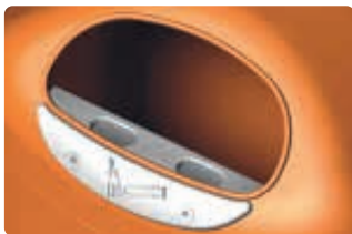
▲ Detail: Ascher