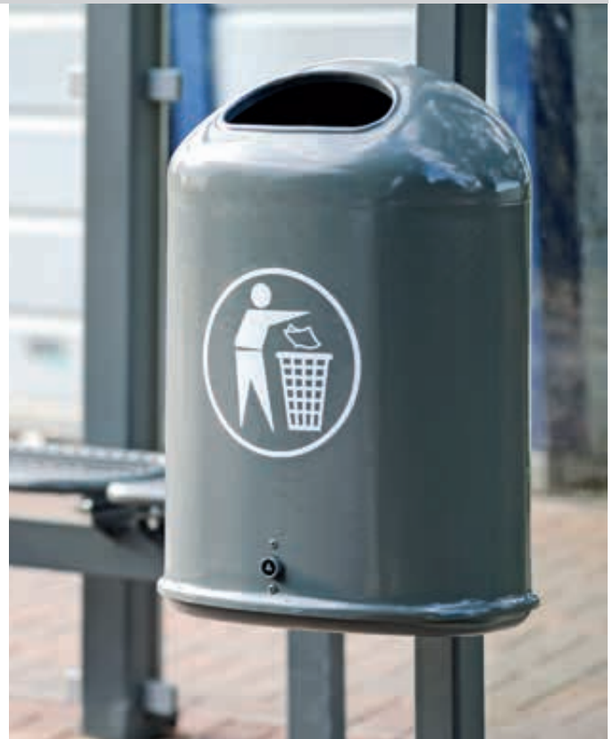
Abfallbehälter DERBY aus Stahl, in DB 703 eisenglimmer