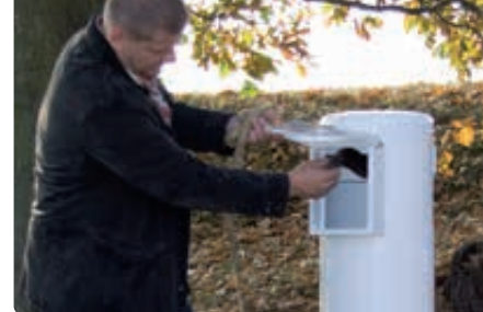
▲ Beutel entnehmen, Hundekot mit umgestülptem Beutel aufnehmen und zuknoten