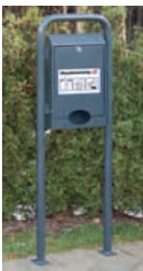
▲ Hundekotbeutel-spender COLLIE, zum Aufdübeln, in RAL 7016 anthrazitgrau