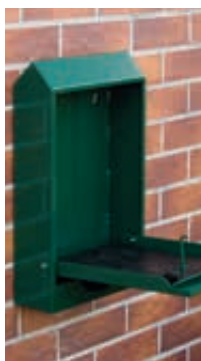
▲ Hundekotbeutel-spender COLLIE, zur Wandbefestigung, in RAL 6005 moosgrün, geöffnet zum Befüllen