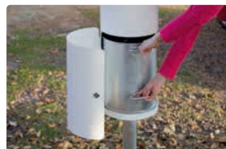
▲ Innenbehälter zum Entleeren entnehmen