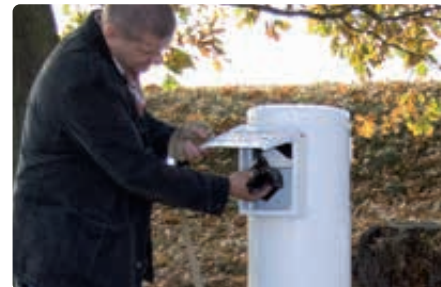
▲ Beutel einwerfen