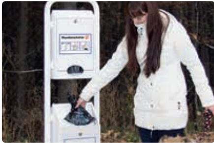
▲ Beutel einwerfen