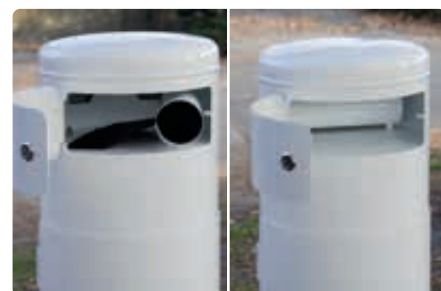
▲ Beutelspender befüllen

Weitere Hundetoiletten finden Sie online unter: www.ziegler-metall.at