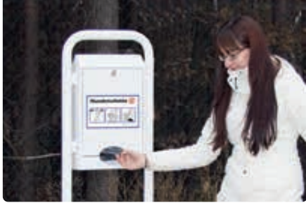
▲ Beutel entnehmen, Hundekot mit umgestülptem Beutel aufnehmen und zuknoten