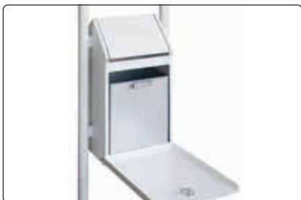
▲ Detail: Entleerung