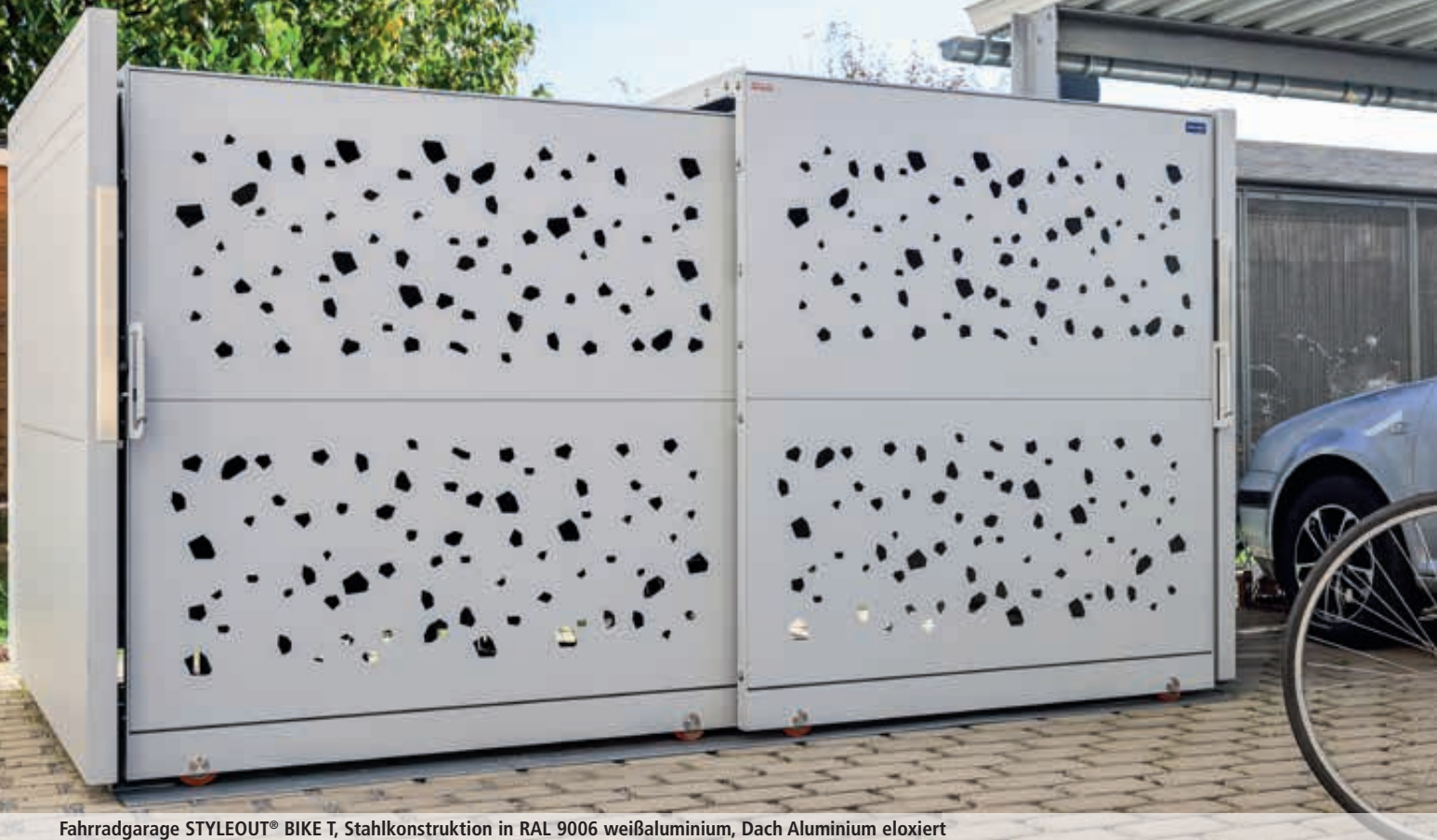
Fahrradgarage STYLEOUT® BIKE T, Stahlkonstruktion in RAL 9006 weißaluminium, Dach Aluminium eloxiert