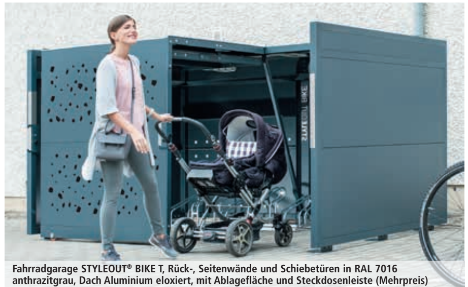
Fahrradgarage STYLEOUT® BIKE T, Rück-, Seitenwände und Schiebetüren in RAL 7016 anthrazitgrau, Dach Aluminium eloxiert, mit Ablagefläche und Steckdosenleiste (Mehrpreis)