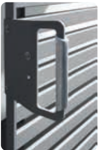
◀ Detail: Handgriff