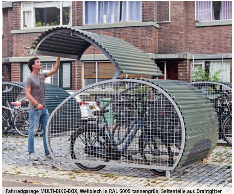
Fahrradgarage MULTI-BIKE-BOX, Wellblech in RAL 6009 tannengrün, Seitenteile aus Drahtgitter

Lieferung: Fertig montiert (Entladen bauseits). Für die Entladung vor Ort wird ein Stapler benötigt.