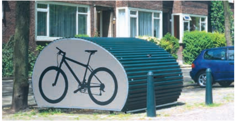
Wellblech in RAL 6005 moosgrün, Seitenteile mit Alu-Dibond-Platte in Standardfarbe 7001 silbergrau, mit Fahrrad-Logo