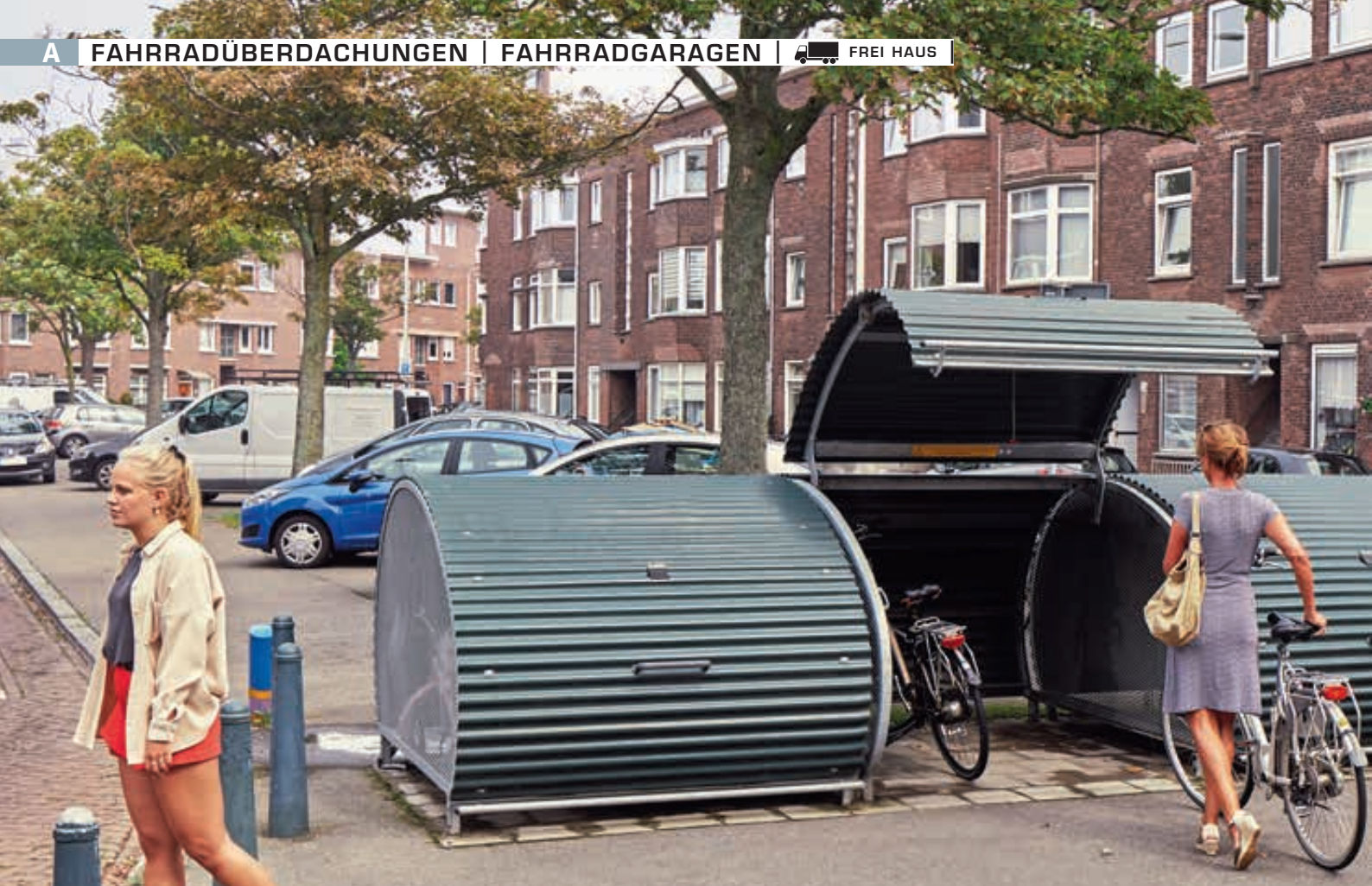
Fahrradgarage MULTI-BIKE-BOX, Wellblech in RAL 6009 tannengrün, Seitenteile aus Streckmetallgitter