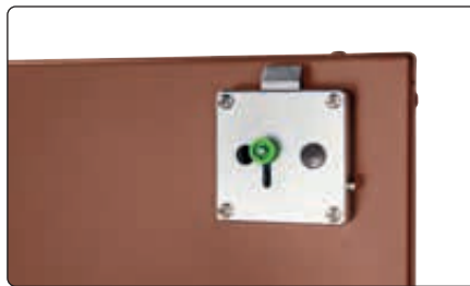
▲ Detail: Kastenschloss mit Notentriegelungsfunktion von innen (nur bei Ausführung „vorgefertigt für bauseitigen Profilhalbzylinder“ im Lieferumfang enthalten)