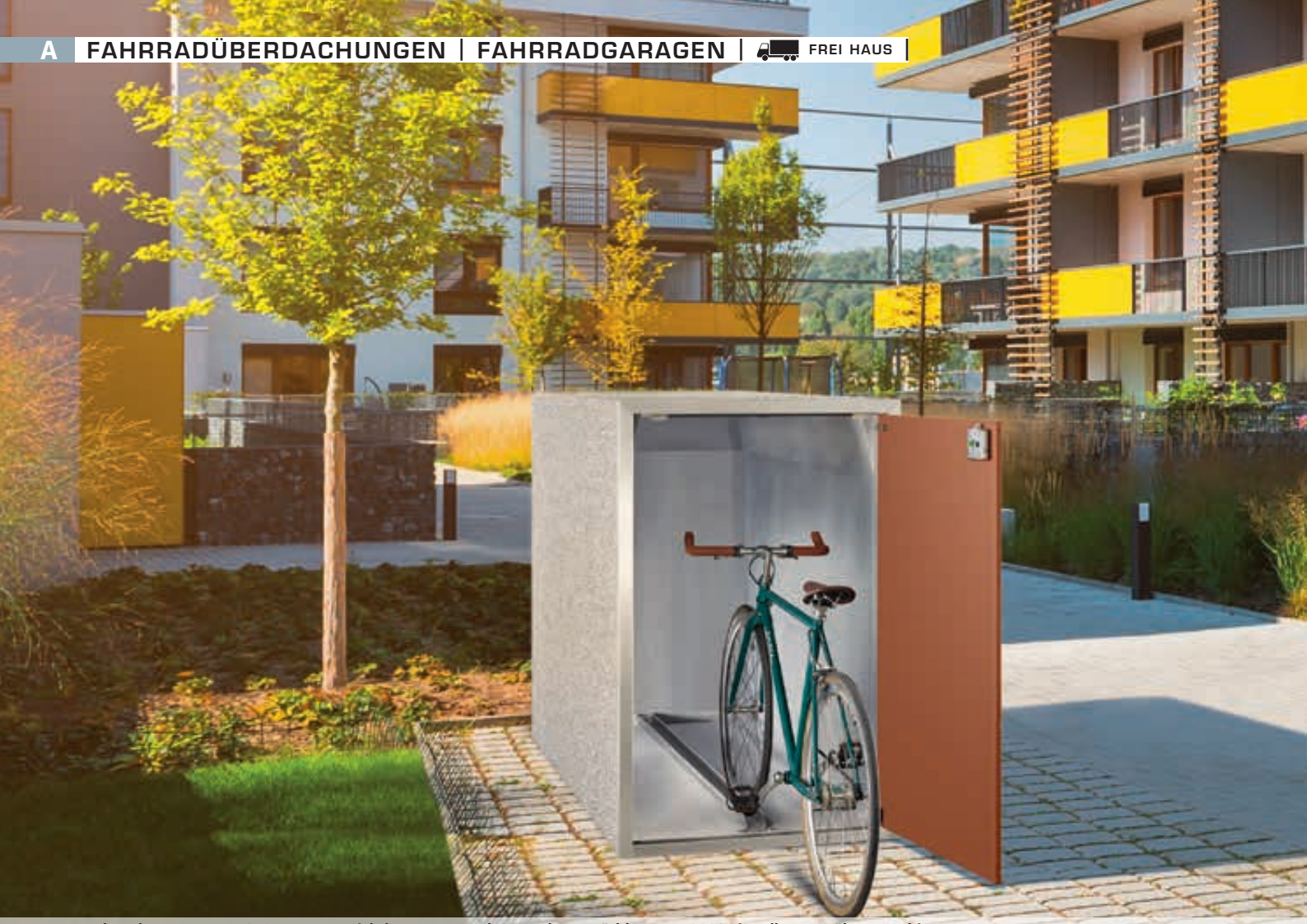
Fahrradgarage ARLINGTON, Korpus Sichtbeton gewaschen, perlgrau, Türblatt RAL 8002 signalbraun, Führungsschiene, Kastenschloss mit Notentriegelung von innen