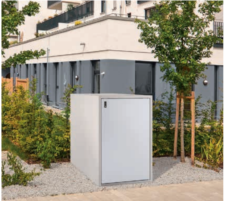
Fahrradgarage ARLINGTON, Korpus Sichtbeton glatt, basisgrau, Türblatt RAL 7035 lichtgrau