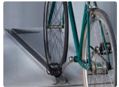
▲ Detail: Führungsschiene, feuerverzinkt

Weitere Bilder, Informationen und Ausschreibungstexte: www.ziegler-metall.de