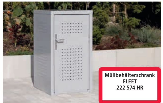
▲ Müllbehälter-Einzelschrank FLEET, in RAL 9006 weißaluminium, Tür mit Türdrücker außen und innen