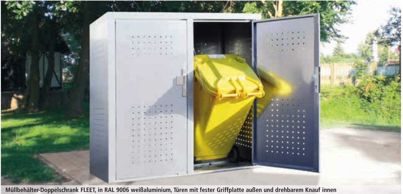
Müllbehälter-Doppelschrank FLEET, in RAL 9006 weißaluminium, Türen mit fester Griffplatte außen und drehbarem Knauf innen