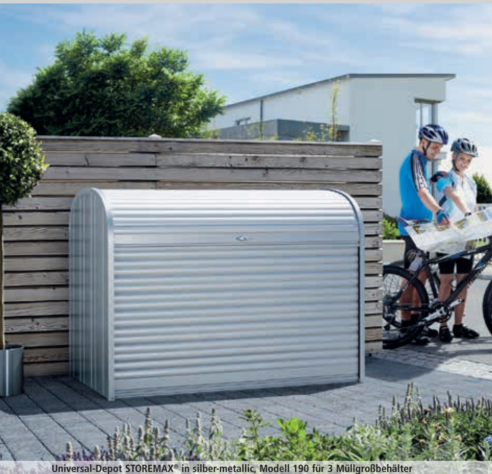
Universal-Depot STOREMAX® in silber-metallic, Modell 190 für 3 Müllgroßbehälter

Konstruktion: Rollläden (zweigeteilt, mit Federunterstützung) und Führungsprofile aus Aluminium. Rückwand, Seitenwände, Rollladenabschlussprofile und Boden aus Stahlblech. Mit Werkzeughalter an den Innenseiten der Seitenwände und der Rückwand. Regal-Sets und Zwischenböden in verschiedenen Ausführungen siehe Zubehör. Fahrradständer-Set auf Anfrage.