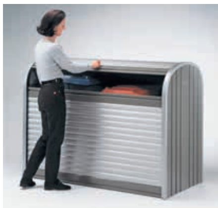
▲ zum Befüllen nur obere Rolllade öffnen