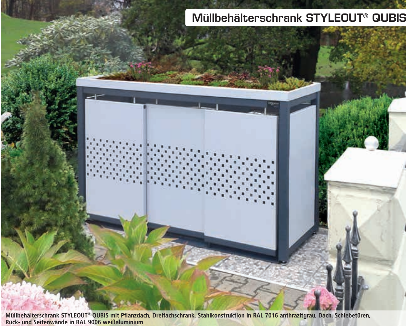
Müllbehälterschrank STYLEOUT® QUBIS mit Pflanzdach, Dreifachschrank, Stahlkonstruktion in RAL 7016 anthrazitgrau, Dach, Schiebetüren, Rück- und Seitenwände in RAL 9006 weißaluminium

Hinweis: Bei diesem Produkt sind je nach beabsichtigter Verwendung ggf. branchen-, länder- oder regionalspezifische Anforderungen (Unfallverhütungsvorschriften, technische Normen VDI, DIN, gesetzliche Regelungen - ggf. baurechtliche Vorgaben und örtliche Abfallentsorgungssatzungen) in Abhängigkeit vom Verwendungsort durch den Käufer zu prüfen und zu beachten.