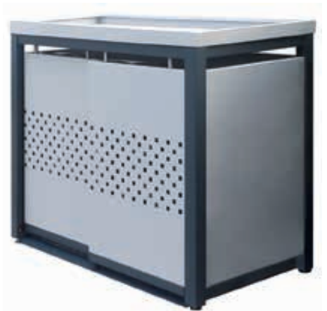
▲ Müllbehälterschrank STYLEOUT® QUBIS mit Pflanzdach, Doppelschrank, Stahlkonstruktion in RAL 7016 anthrazitgrau, Dach, Schiebetüren, Rück- und Seitenwände in RAL 9006 weißaluminium