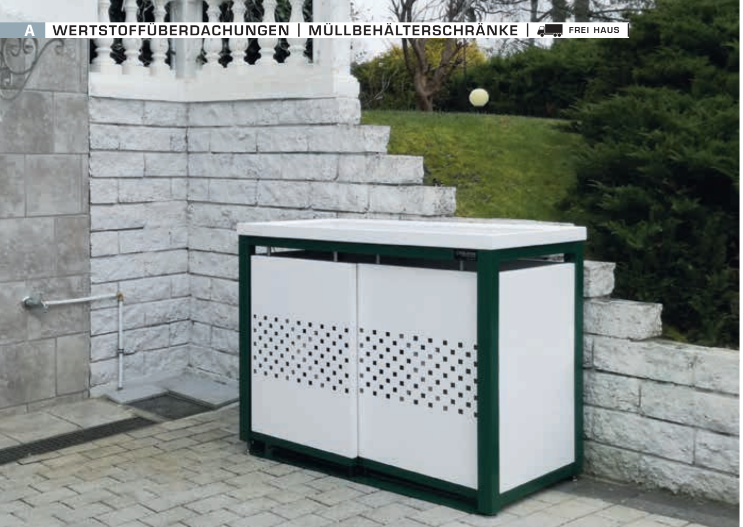
Müllbehälterschrank STYLEOUT® QUBIS mit Pflanzdach, Doppelschrank, Stahlkonstruktion in RAL 6005 moosgrün, Dach, Schiebetüren, Rück- und Seitenwände in RAL 9003 signalweiß