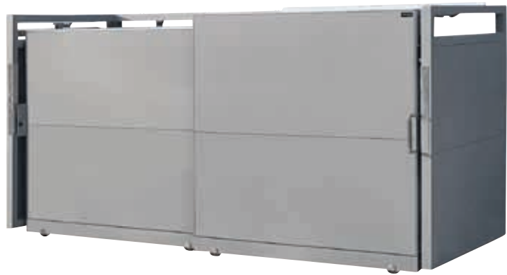
▲ Müllbehälter-Doppelschrank STYLEOUT® BLANK 1100, Aluminiumkonstruktion in RAL 9007 grau/aluminium

Weitere Bilder, Informationen und Ausschreibungstexte: www.ziegler-metall.de