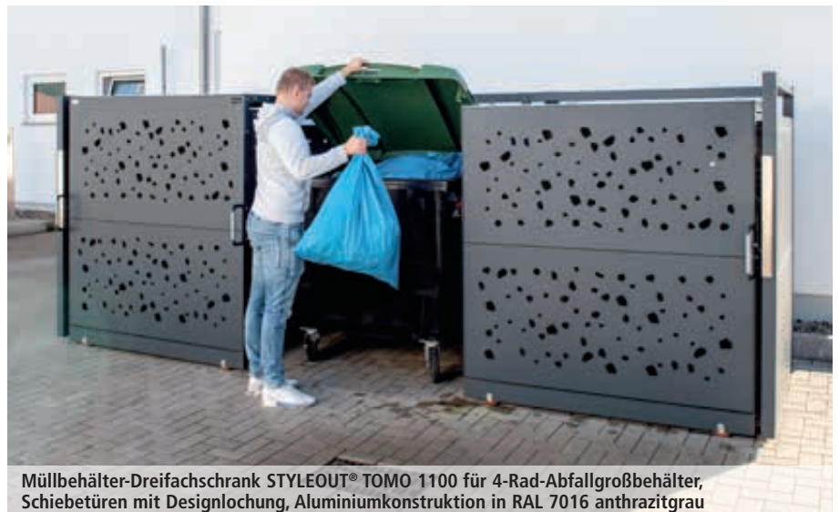
Müllbehälter-Dreifachschränk STYLEOUT® TOMO 1100 für 4-Rad-Abfallgroßbehälter, Schiebetüren mit Designlochung, Aluminiumkonstruktion in RAL 7016 anthrazitgrau