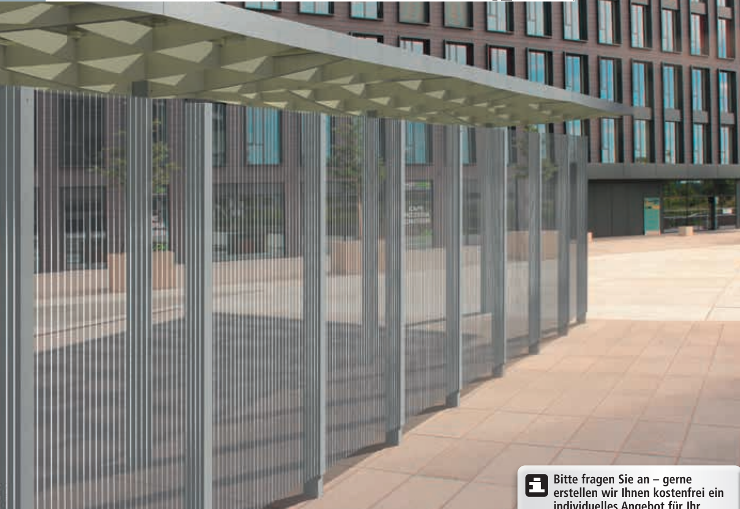
Windschutzwand PIN SCREEN und Meeting-Point PIN, Stahlkonstruktion in RAL 9007 grau aluminium bzw. RAL 1020 olivgelb