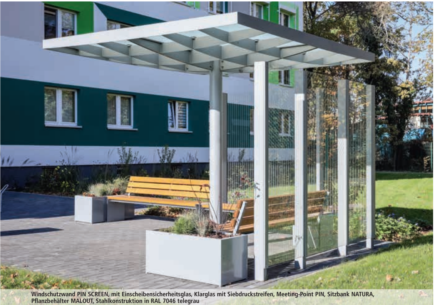
Windschutzwand PIN SCREEN, mit Einscheibensicherheitsglas, Klarglas mit Siebdruckstreifen, Meeting-Point PIN, Sitzbank NATURA, Pflanzbehälter MALOUT, Stahlkonstruktion in RAL 7046 telegrau