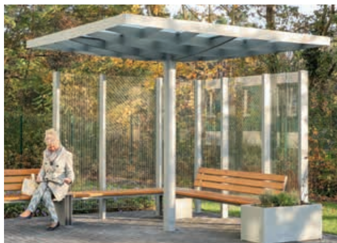
Windschutzwand PIN SCREEN, mit Einscheibensicherheitsglas, Klarglas mit Siebdruckstreifen, Meeting-Point PIN, Sitzbank NATURA, Pflanzbehälter MALOUT, Stahlkonstruktion in RAL 7046 telegrau