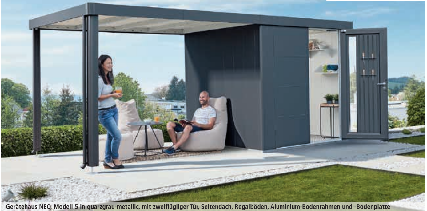
Gerätehaus NEO, Modell 5 in quarzgrau-metallic, mit zweiflügliger Tür, Seitendach, Regalböden, Aluminium-Bodenrahmen und -Bodenplatte