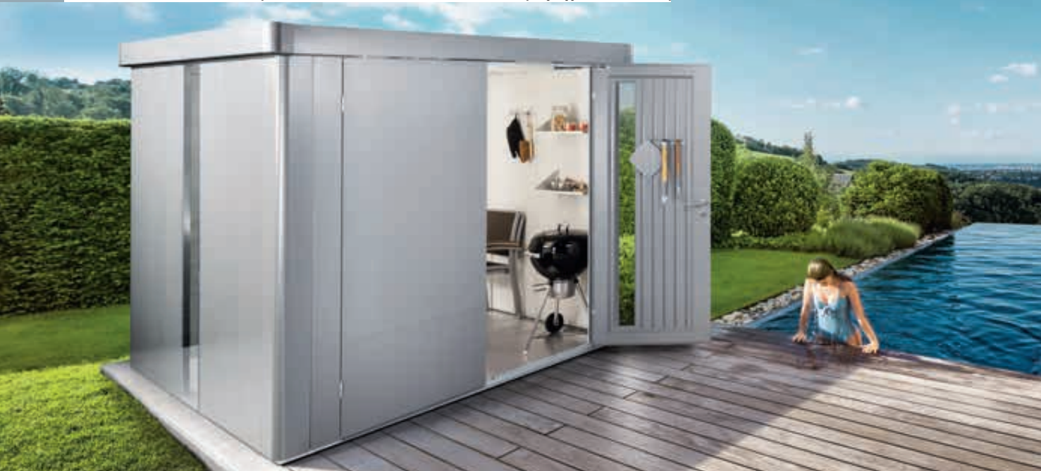
Gerätehaus NEO, Modell 6 in silber-metallic, mit Tür zweiflügelig, Lichtpanel, Regalböden, Aluminium-Bodenrahmen und -Bodenplatte