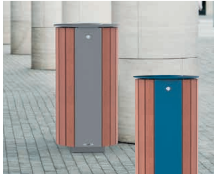
▲ Abfallbehälter MIANE mit Ascher, mit Sapeliholzbelattung, Stahlteile in RAL 9007 grau aluminium bzw. in RAL 5010 enziyanblau