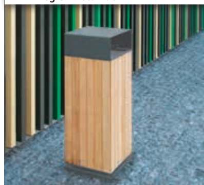
▲ Abfallbehälter NANUK, Standbehälter mit Schutzdach, Korpus: Robinienholzbelattung