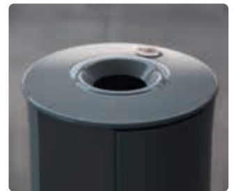
▲ Detail: Einwurfföffnung