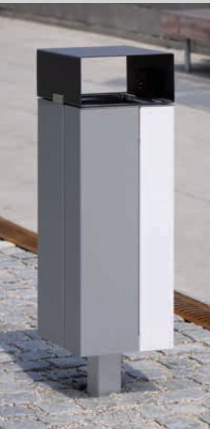
▲ Abfallbehälter NANUK, mit Schutzdach, Korpus: Stahlblech, zweifarbig auf Anfrage