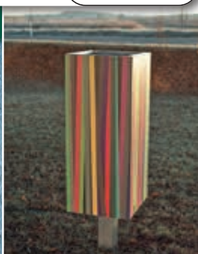
▲ Abfallbehälter NANUK, Korpus: Hochdrucklaminat