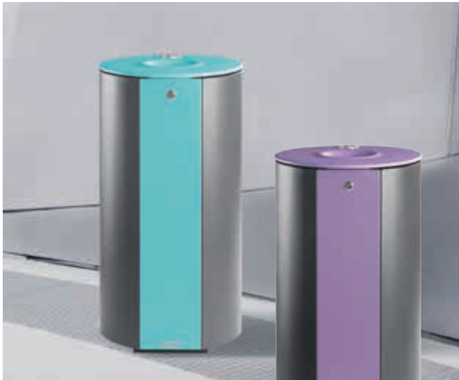
▲ Abfallbehälter MIANE mit Ascher, Stahlteile in RAL 6027 lichtgrün und RAL 9007 grau aluminium bzw. Stahlteile in RAL 4005 blaulila und RAL 7012 basaltgrau