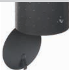
▲ Bodenklappe öffnet nach Entriegelung