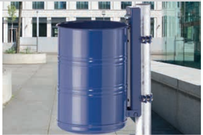
Abfallbehälter NOSTALGIA, Vollblech, 35 Liter, in RAL 5013 kobaltblau, mit Befestigungsschellen-Set (Mehrpreis) befestigt an feuerverzinktem Pfosten (Zubehör)