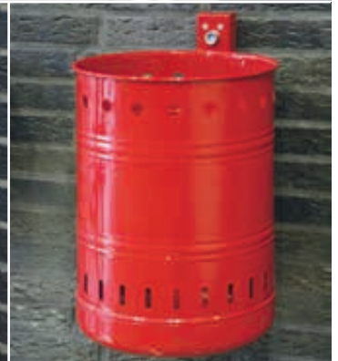
▲ Abfallbehälter NOSTALGIA mit Lochoptik, Inhalt 20 Liter, feuerverzinkt ▲ Abfallbehälter NOSTALGIA mit Lochoptik, Inhalt 35 Liter, in RAL 3002 karminrot