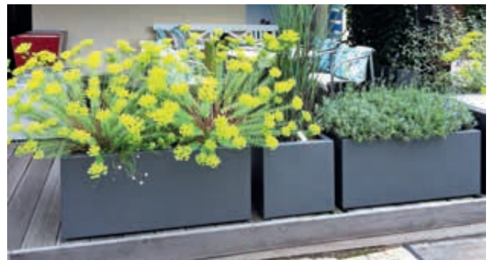
▲ Pflanzbehälter MALOUT, 89 Liter bzw. 34 Liter, in DB 703 eisenglimmer