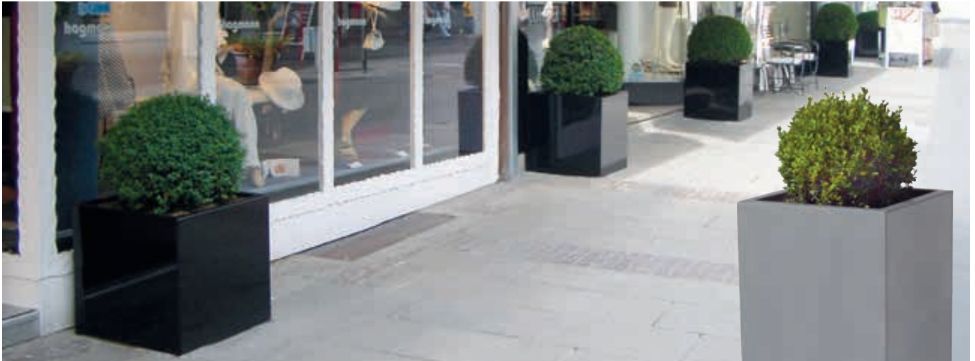
Pflanzbehälter MALOUT, 191 Liter, in RAL 9005 tiefschwarz