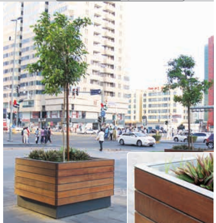
Pflanzbehälter KVETA, 1280 Liter, mit Jatobaholzbelattung, Stahlteile in RAL 7016 anthrazitgrau