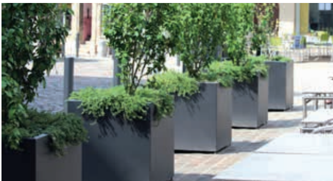
▲ Pflanzbehälter MALOUT, 246 Liter, Höhe 700 mm, in DB 703 eisenglimmer