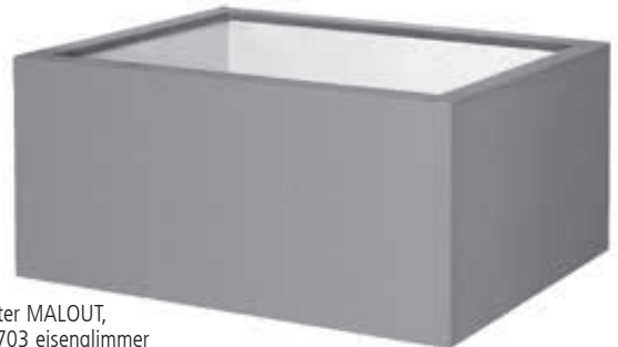
► Pflanzbehälter MALOUT, 89 Liter, in DB 703 eisenglimmer