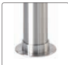
▲ Sockelring aus Edelstahl (siehe Zubehör)