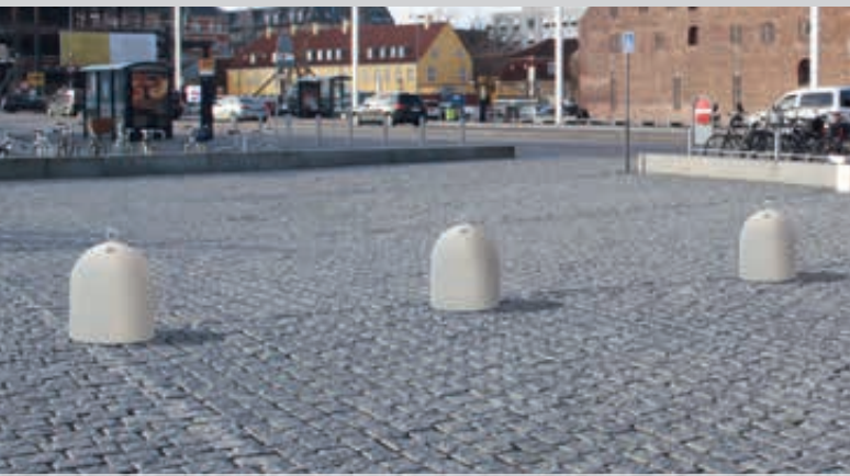
Poller TIP aus Beton, in Granitoptik weiß

Konstruktion: Poller aus Beton bzw. rekonstituiertem Marmor mit abschraubbarer Öse, welche der Entladung bzw. dem Transport dient.