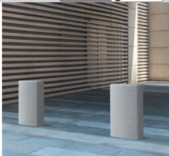
Poller DENZ aus rekonstituiertem Marmor, in weiß carrara