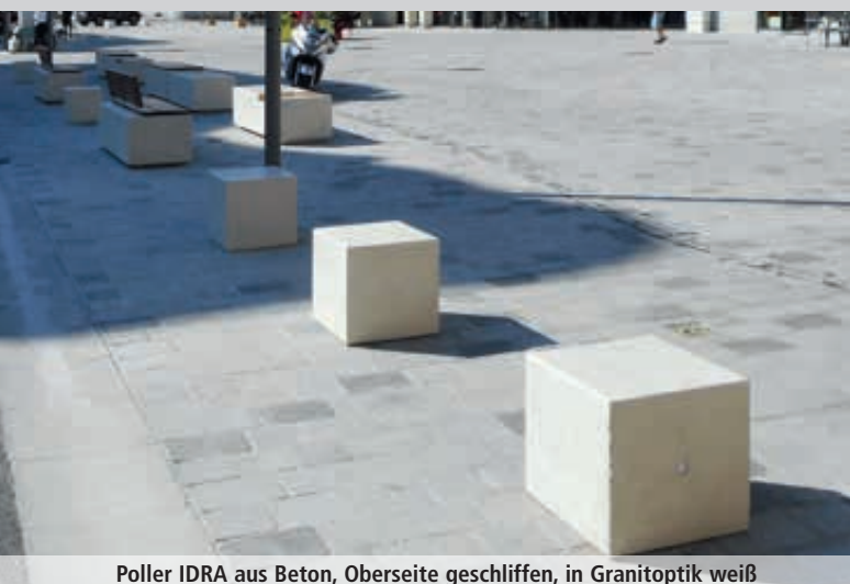
Poller IDRA aus Beton, Oberseite geschliffen, in Granitoptik weiß

Konstruktion: Poller aus Beton bzw. rekonstituiertem Marmor mit einer Stahlbewehrung verstärkt. Alle Kanten sind abgerundet.