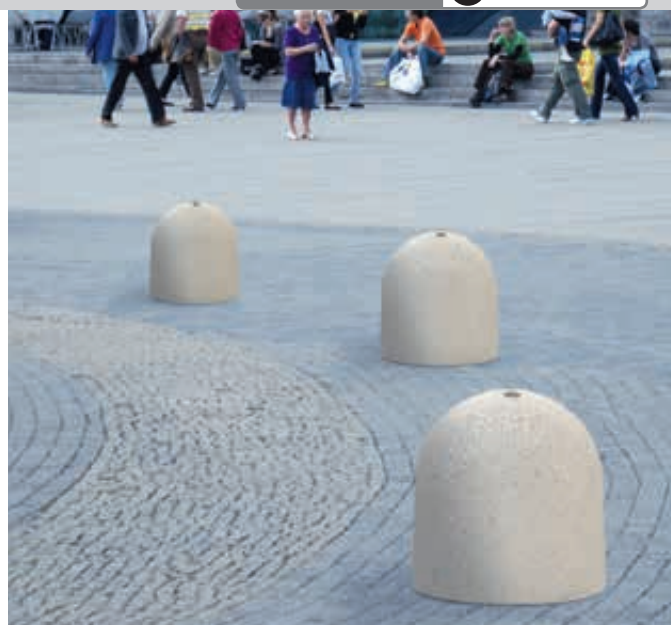
Poller TITANO aus Beton sandgestrahlt, in Granitoptik weiß

Standardfarben rekonstituierter Marmor für diese Doppelseite - bitte bei Bestellung Farbe angeben!